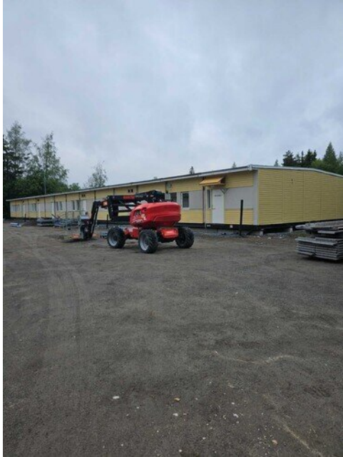
Väistötiloilla Rakennus 1 kasattu