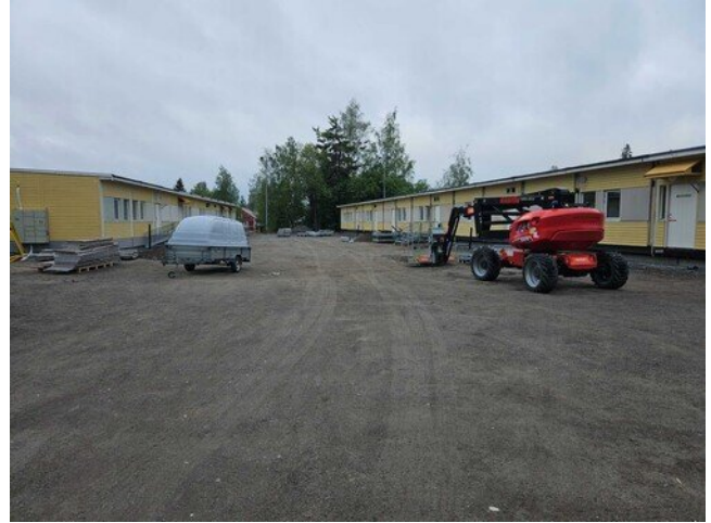
Väistötilat pihat viimeistellään ensi viikolla