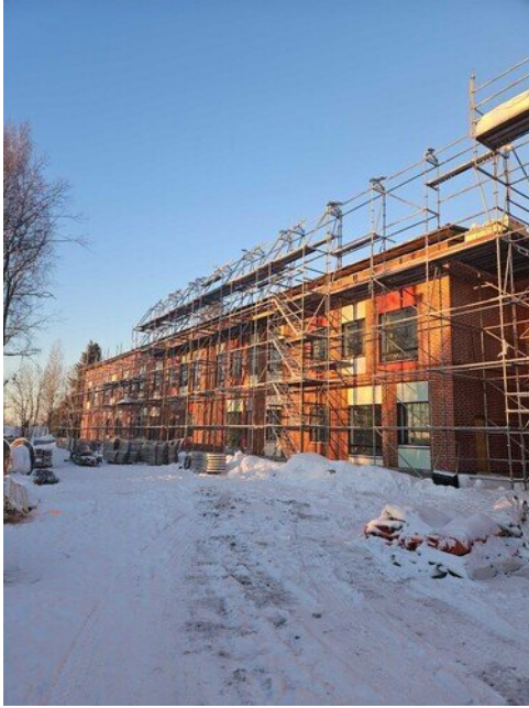
Sääsuojasta purettu kattoristikot ja osa sivutelineistä