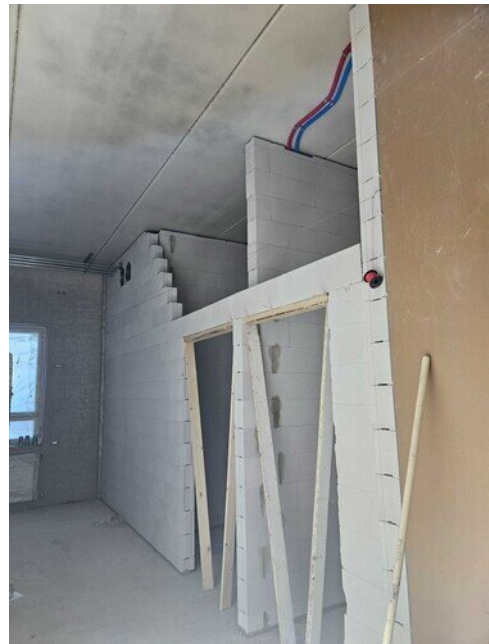
Väliseinämuuraus on tuon verran kesken