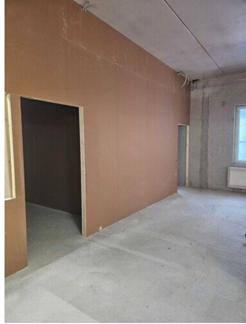
Tuplaukset alkaneet väliseinien osalta