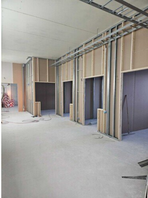
Tuplausta riittää, kuvassa hallintosiipi