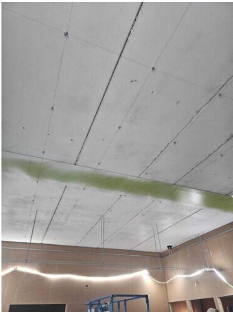
Ääntä eristävän alakaton kiinnikkeitä asennettu