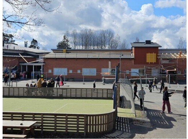
Konesaumapeltiä varten pohja valmiina uuden iv- konehuoneen vasemmalla puolella