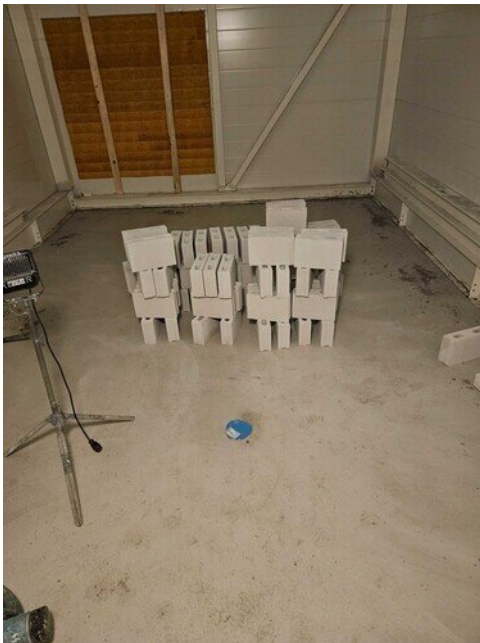
Iv-konehuoneen lattia on valettu ja vesieristestön tiilet odottavat asennusta