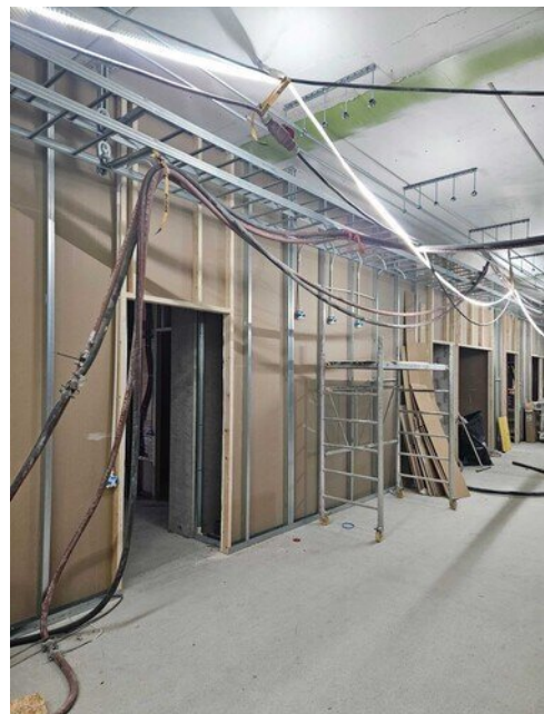
1 krs käytävän seinää