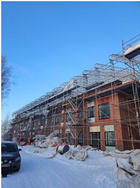
Sääsuojasta pressut tiputettu alas