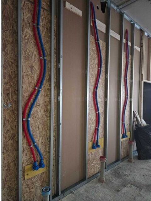
Vesiputket kiinnitetty tukevasti