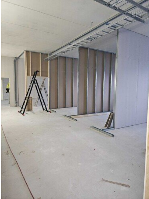
2 krs väliseiniä hallintosiivessä