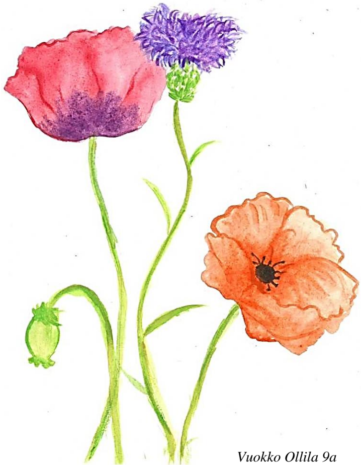
Vuokko Ollila 9a