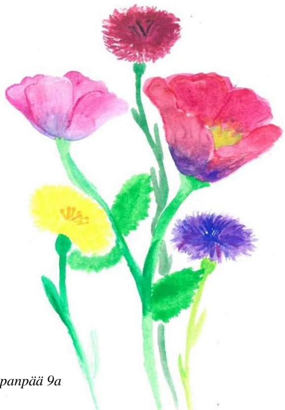
Päivi Vuori, rehtori