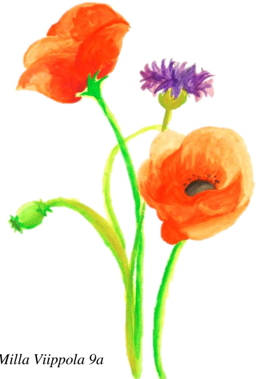
Milla Viippola 9a

1. 9.00 – 9.45 2. 10.00 – 10.45 3. 11.00 – 11.45 RUOKAILU 4. 12.30 – 13.15 5. 13.30 – 14.15 6. 14.15 – 15.00 7. 15.00 – 15.45