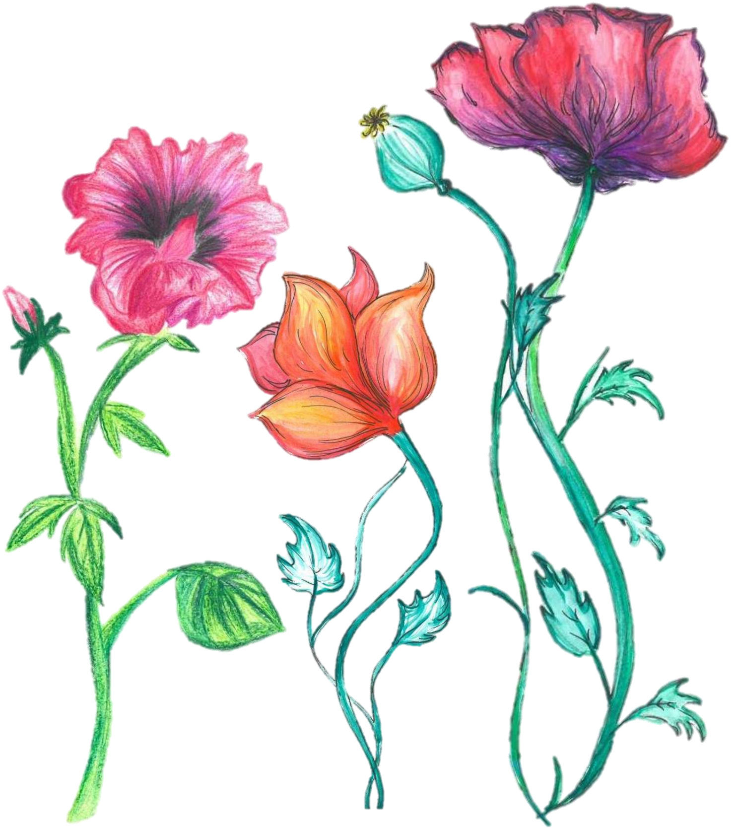
Tiia Riihioja 7b