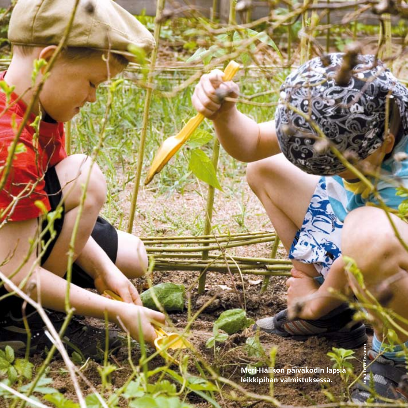
Meri-Halikon päiväkodin lapsia leikkiastian valmistuksessa.