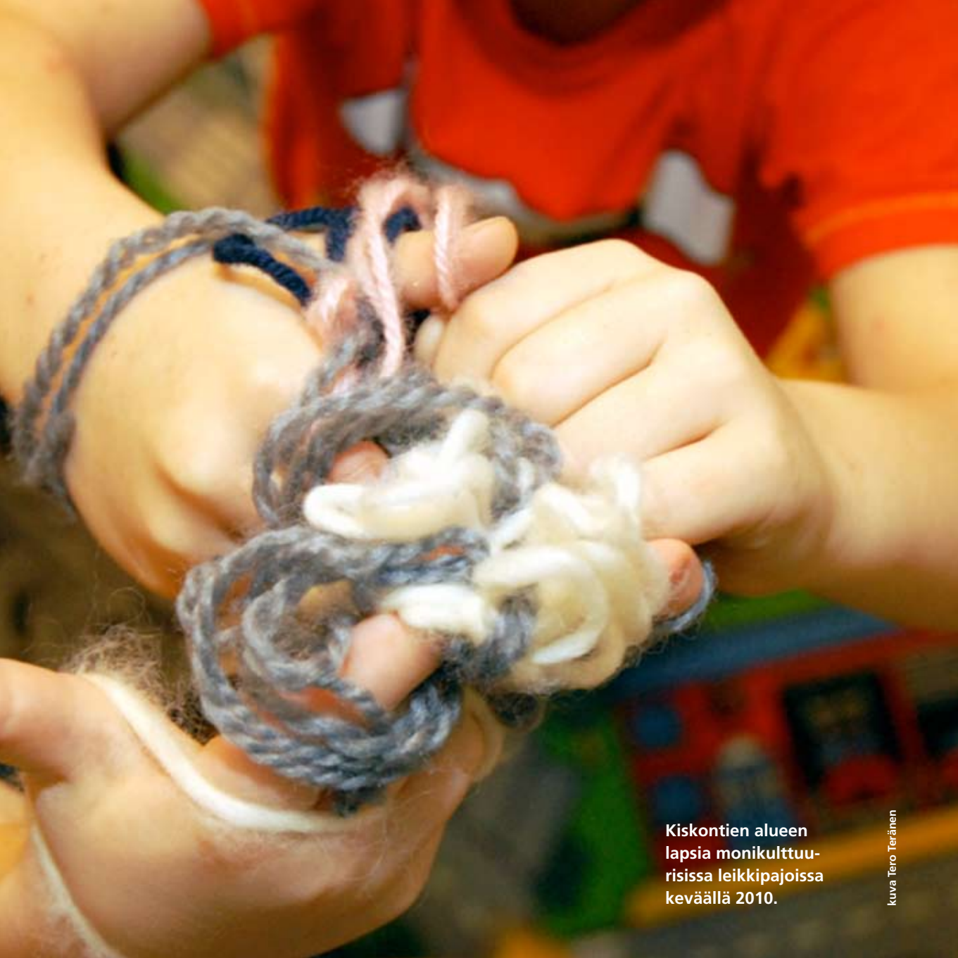
Kiskontien alueen lapsia monikulttuurisissa leikkipajoissa keväällä 2010.