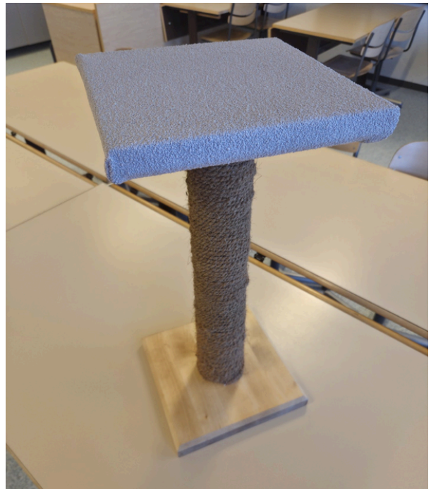
Tekstiilityön tunneilla kevään aikana valmistuneita töitä valinnaisaineissa.