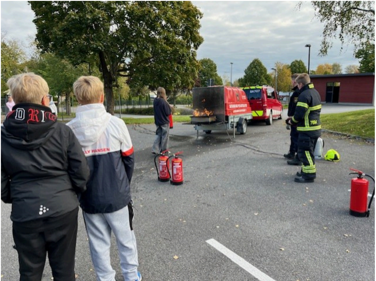
Alkusammutusharjoitus kaikille seiskaluokille 1.10.2025.