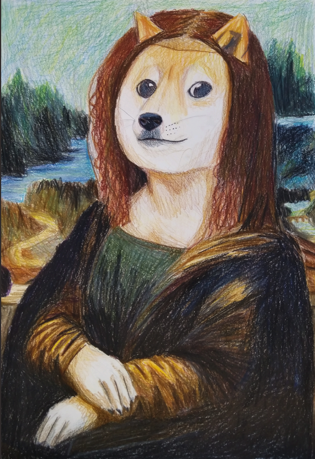
Etukannen teos: Aino Hänninen