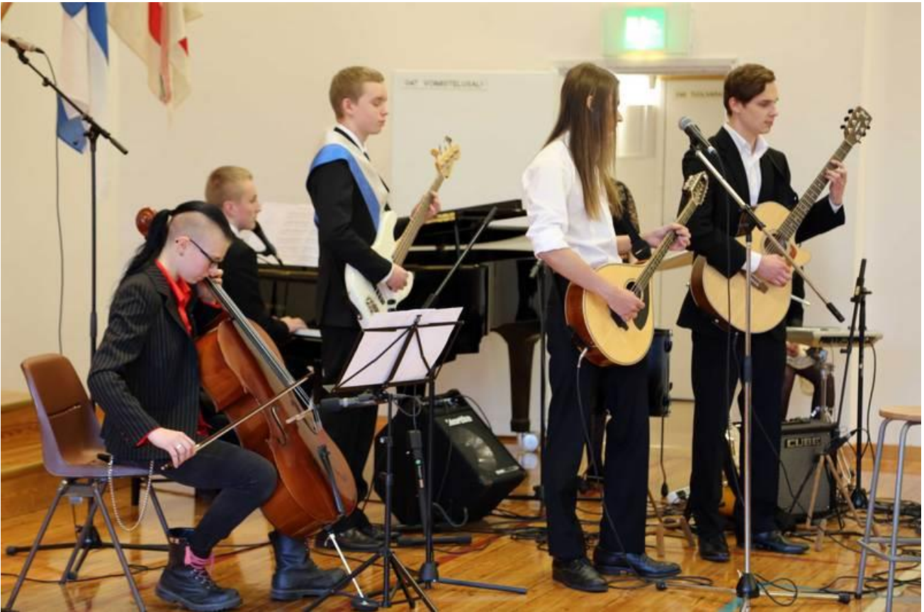
Ylioppilas- ja itsenäisyysjuhla 2014