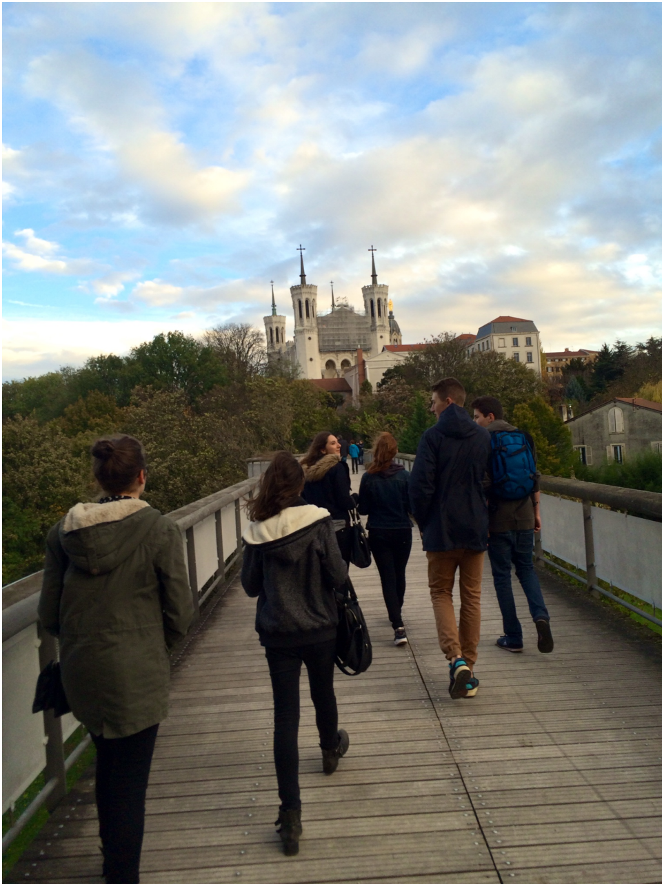
Päivällä tutustuimme hieman Lyoniin muiden kanssa.