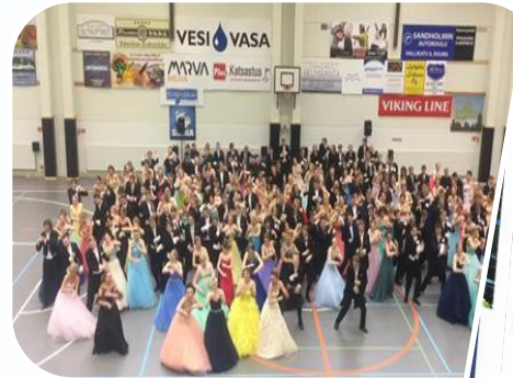
De gamlas dans är ett traditionellt jippo i vår skola.