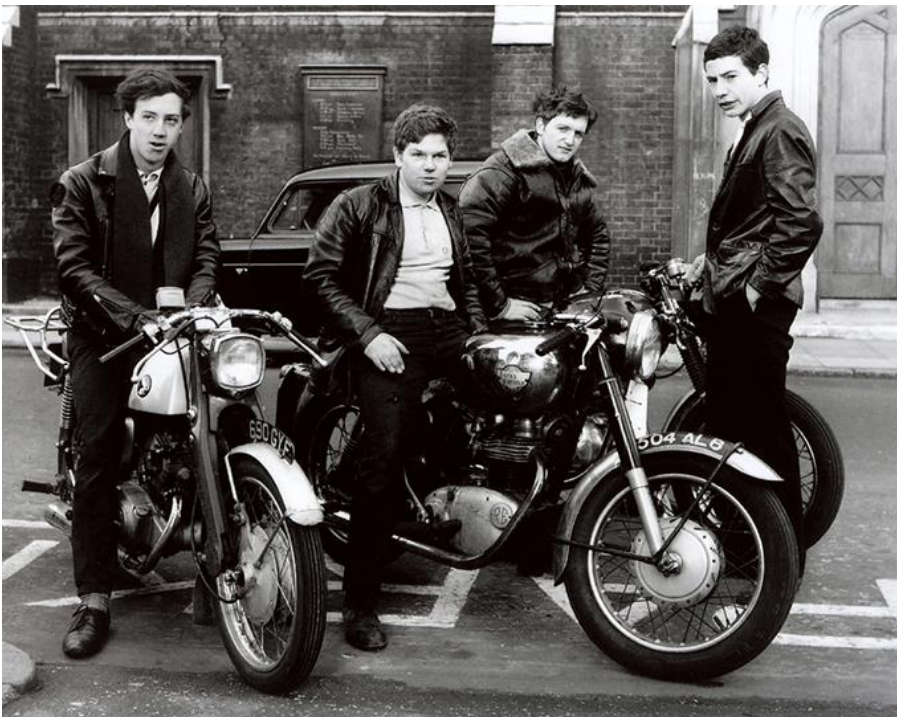
4.B Kuva: Rokkarit moottoripyörineen Yhdysvalloissa 1950-luvun lopussa