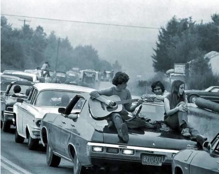
4.A Kuva: Nuorisoa lähdössä kohti Woodstock-festivaalia 1969.