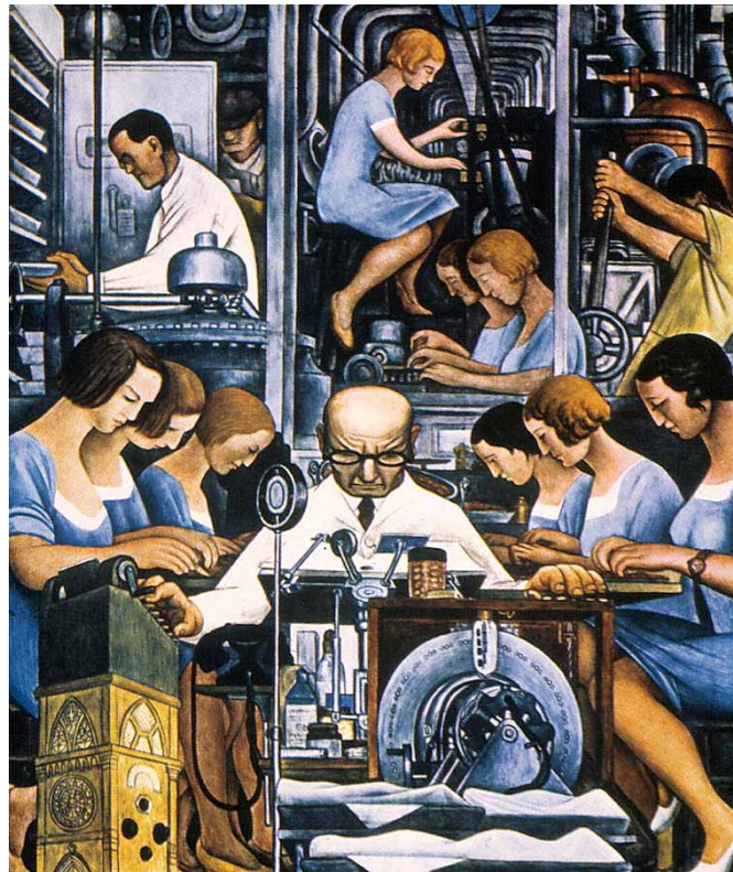
Diego Rivera, Detroit Industry , 1933, Detroit Institute of Arts.