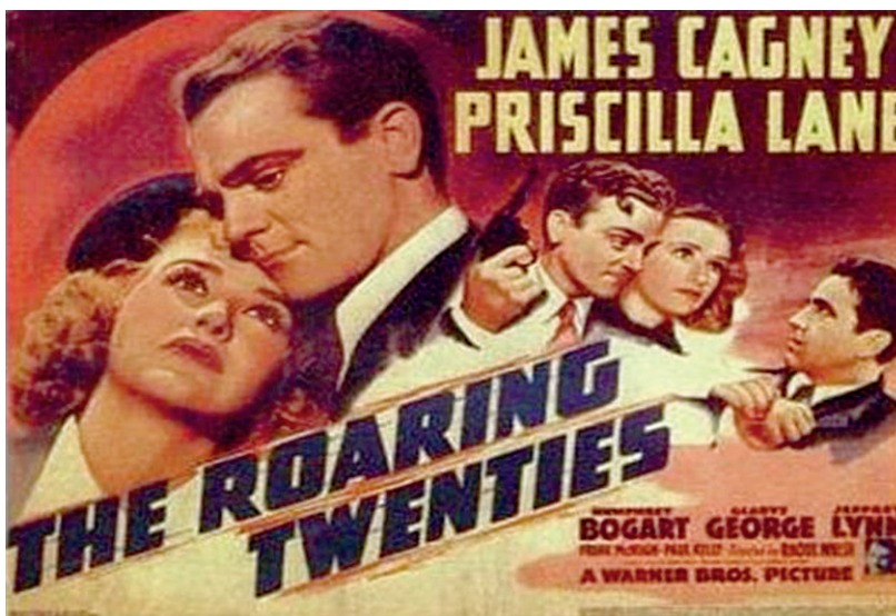
elokuvajuliste vuodelta 1939 < http://www.bing.com >. Luettu 19.3.2015.