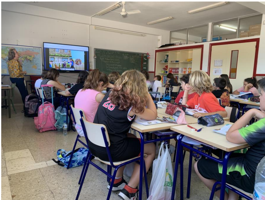
Luokissa on keskimäärin 25 oppilasta.