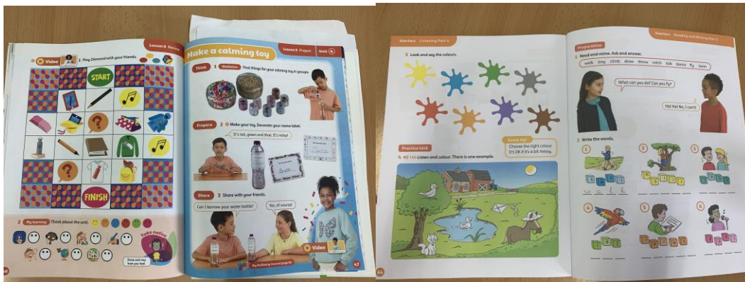
Englanninopetuksessa on käytössä brittiläinen opetusmateriaali.