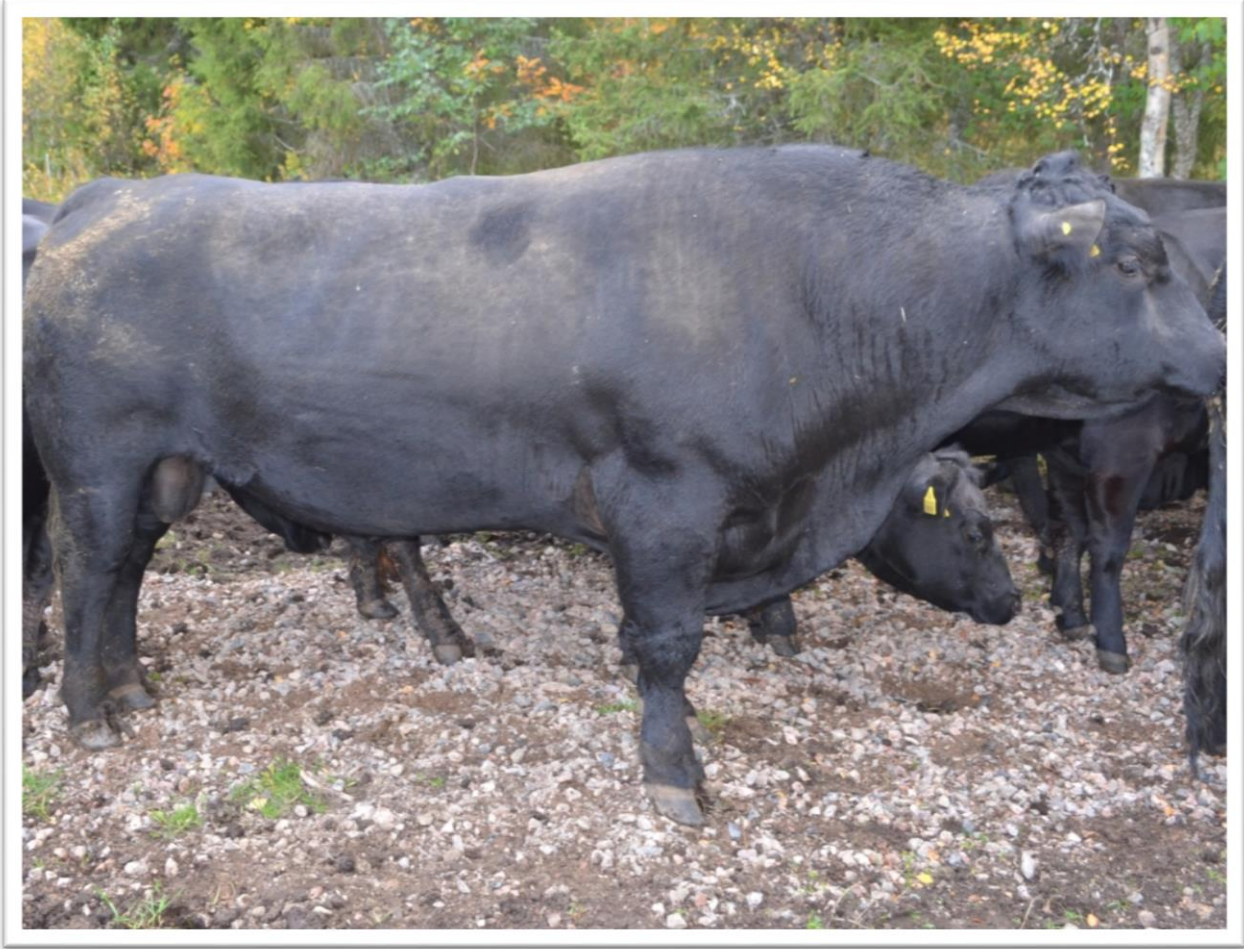
Sonni, Vasikan isä