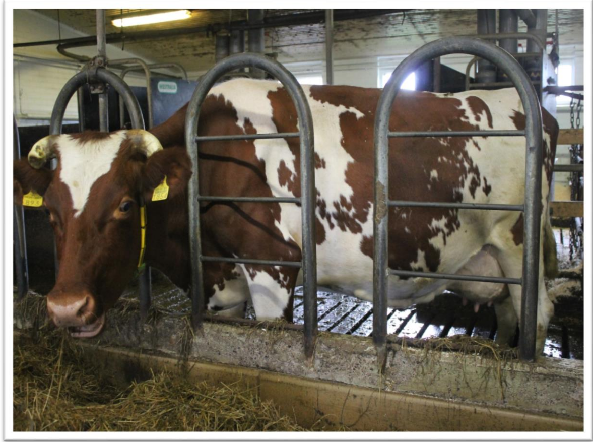
Lehmä, Vasikan äiti