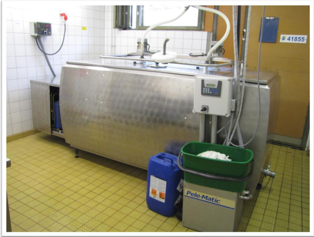
Tilatankki, Tilasäiliö, Maitotankki