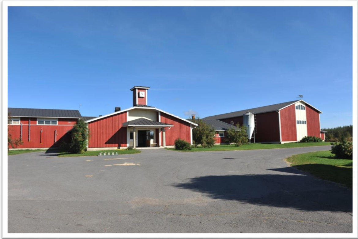
Navetta, Rakennus, jossa lehmät asuvat