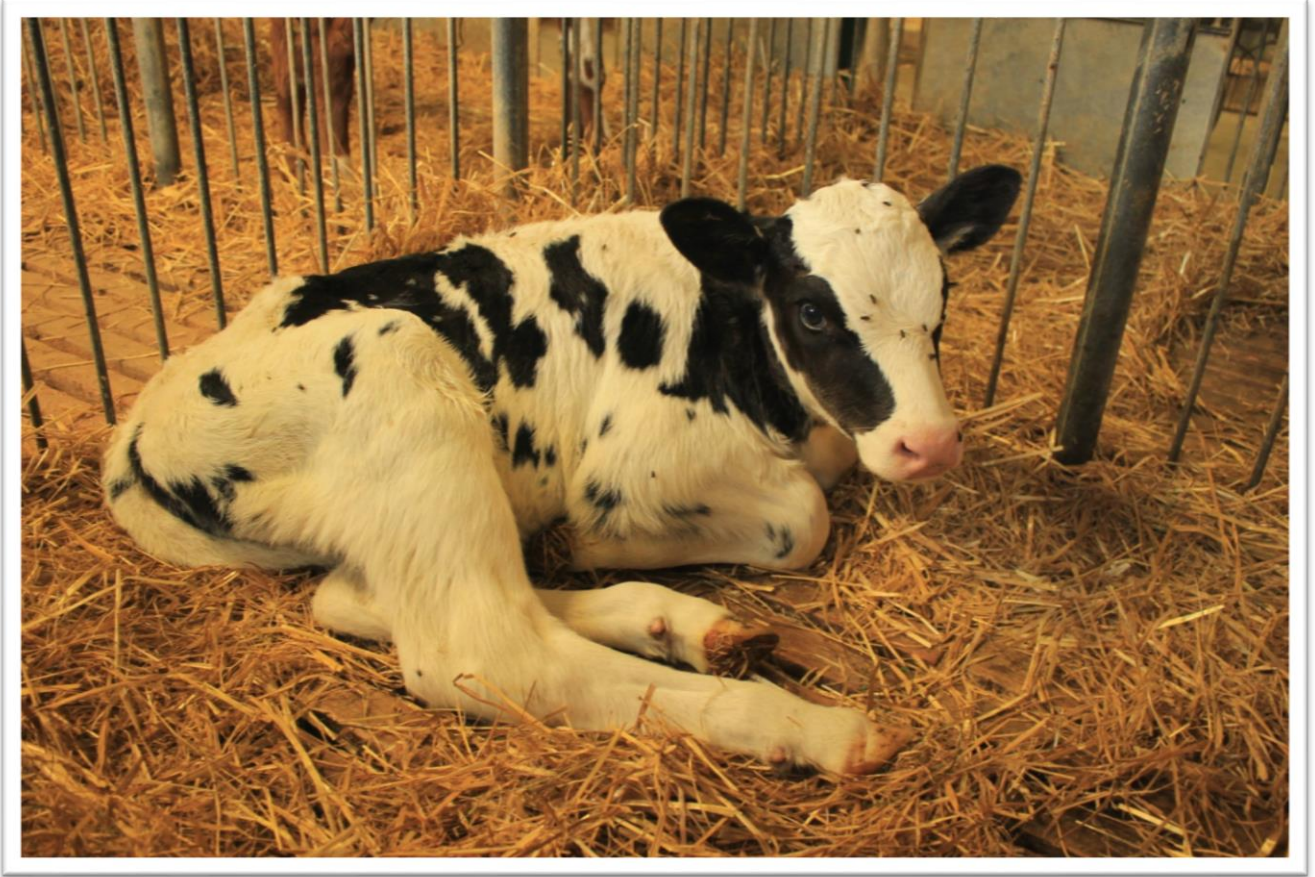
Vasikka, Lehmän lapsi