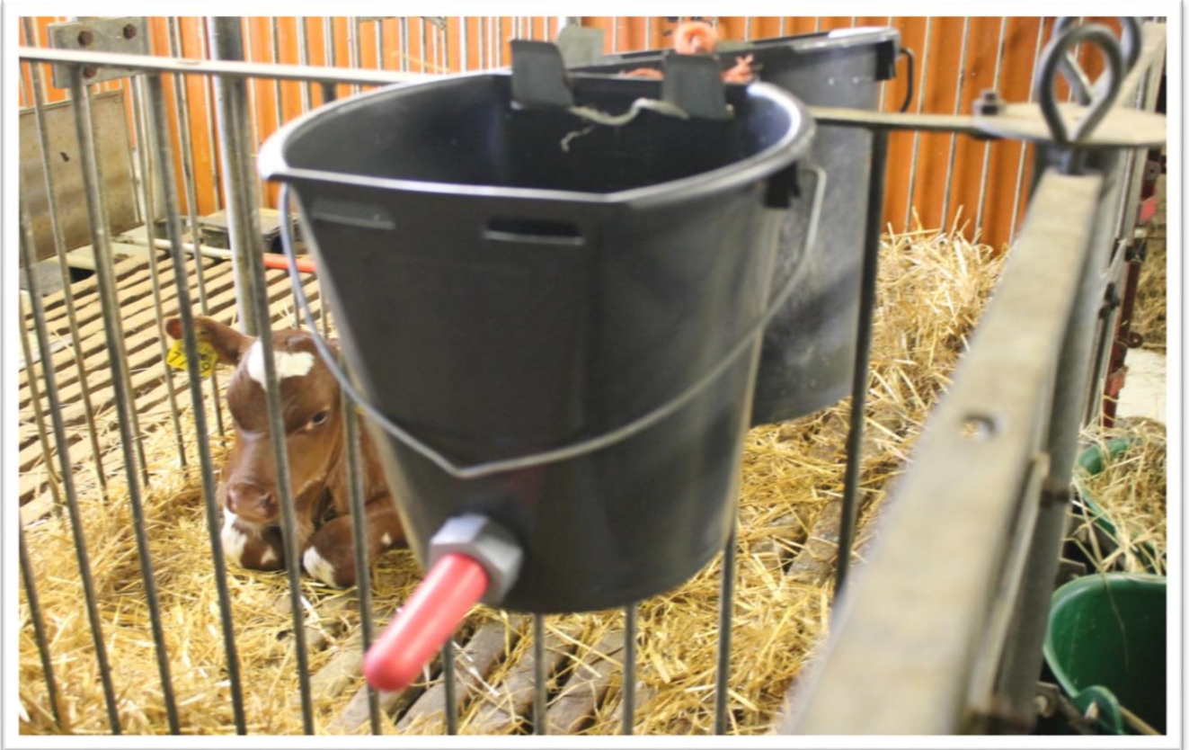
Juottoämpäri, Tuttiämpäri, Tuttisanko