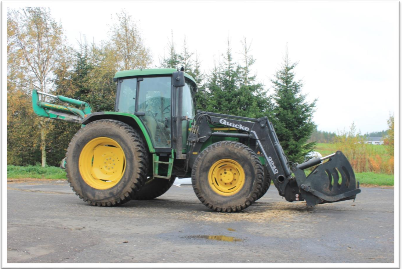
Traktori, Paalileikkuri, Rehuleikkuri