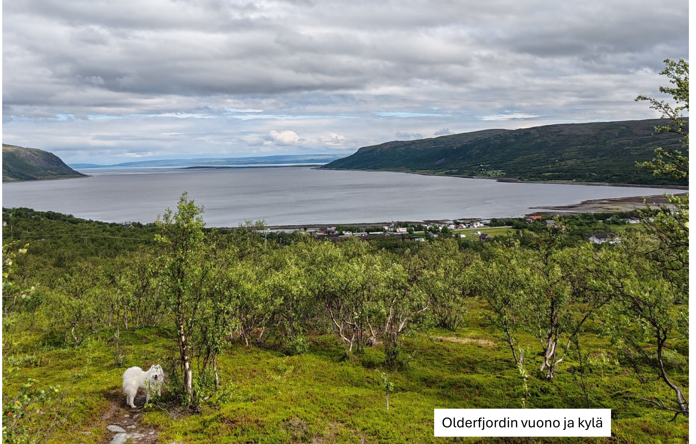
Olderfjordin vuono ja kylä