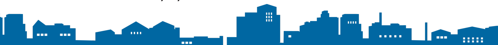
Kuva 2. Poissaolot / huolen vyöhykkeistö

POISSAOLOT ovat vakavia, oppilas on syrjäytymisvaarassa ja koulunkäynti ei ole enää säännöllistä. Oppilas on voinut jäädä kotiin kokonaan. Tiivis monialainen yhteistyö oppilaan, huoltajan, oppilashuollon, perheneuvolan ja lapsi- ja perhesosiaalityön yms. tahojen kanssa.