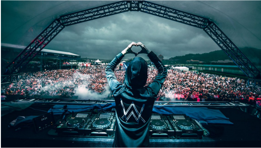
Lavakuvaa norjalaisen EDM-artisti ja DJ Alan Walkerin konsertista.