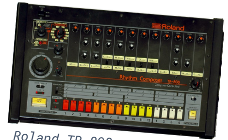
Roland TR-808 -rumpukone

Erilaiset elektronisen musiikin lajit kilpailivat suuremman yleisön tunnustuksesta 1960-luvun lopulta alkaen, mutta vasta 1990 niiden läpimurto toteutui. 90-luvulla tietokoneiden, niiden oheislaitteiden ja ohjelmien kehittyessä ja hiljalleen halventuessa kuka tahansa pystyi tuottamaan musiikkia omalla tietokoneellaan. Tämä kehityskulku on vain vauhdittunut 2000-luvun aikana: laitteistojen halpeneminen ja kehitys on johtanut siihen, että 2000-luvulla on tehty valtavat määrät elektronista musiikkia. Elektronista musiikkia esittävät tyypillisimmin yksittäiset artistit, DJ:t tai duot. Elektronisen musiikin suuntauksista EDM ( Electronic Dance Music ) on ollut viimeisen vuosikymmenen suurimpia musiikillisia ilmiöitä.