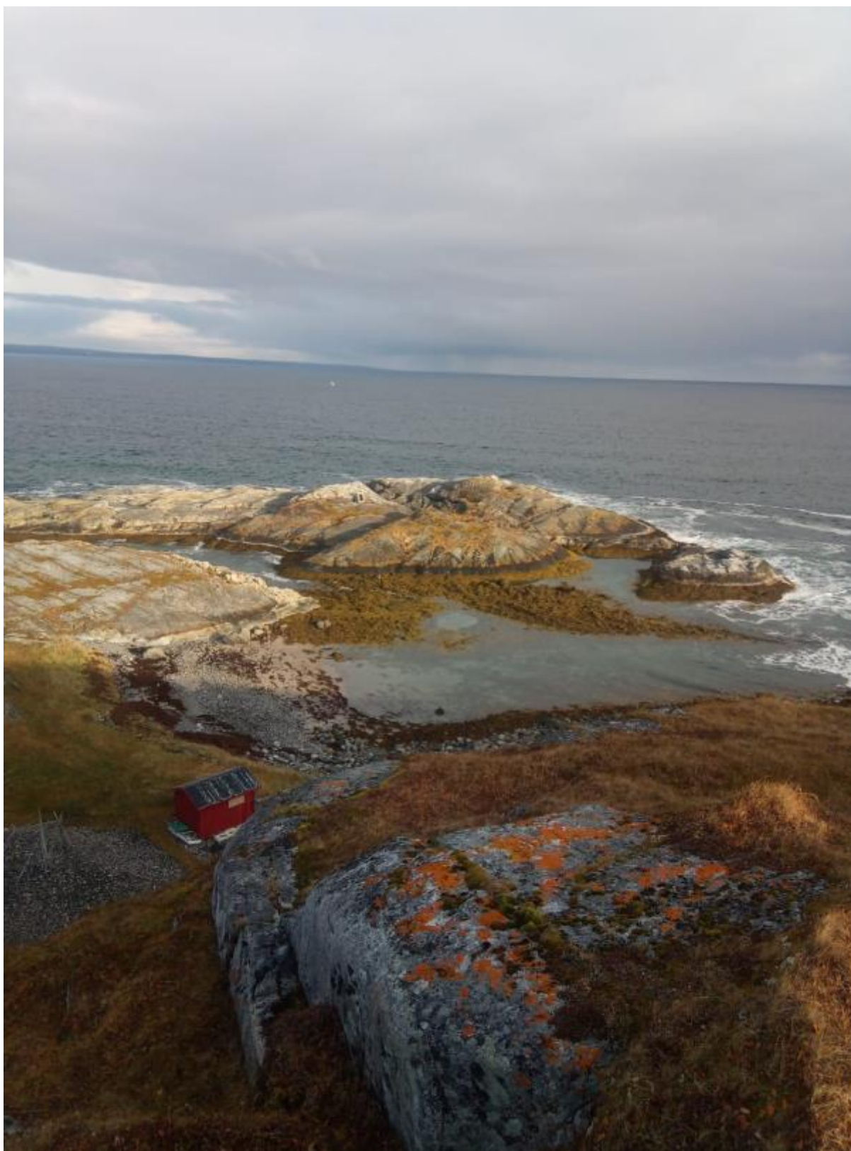
Norja ja porot