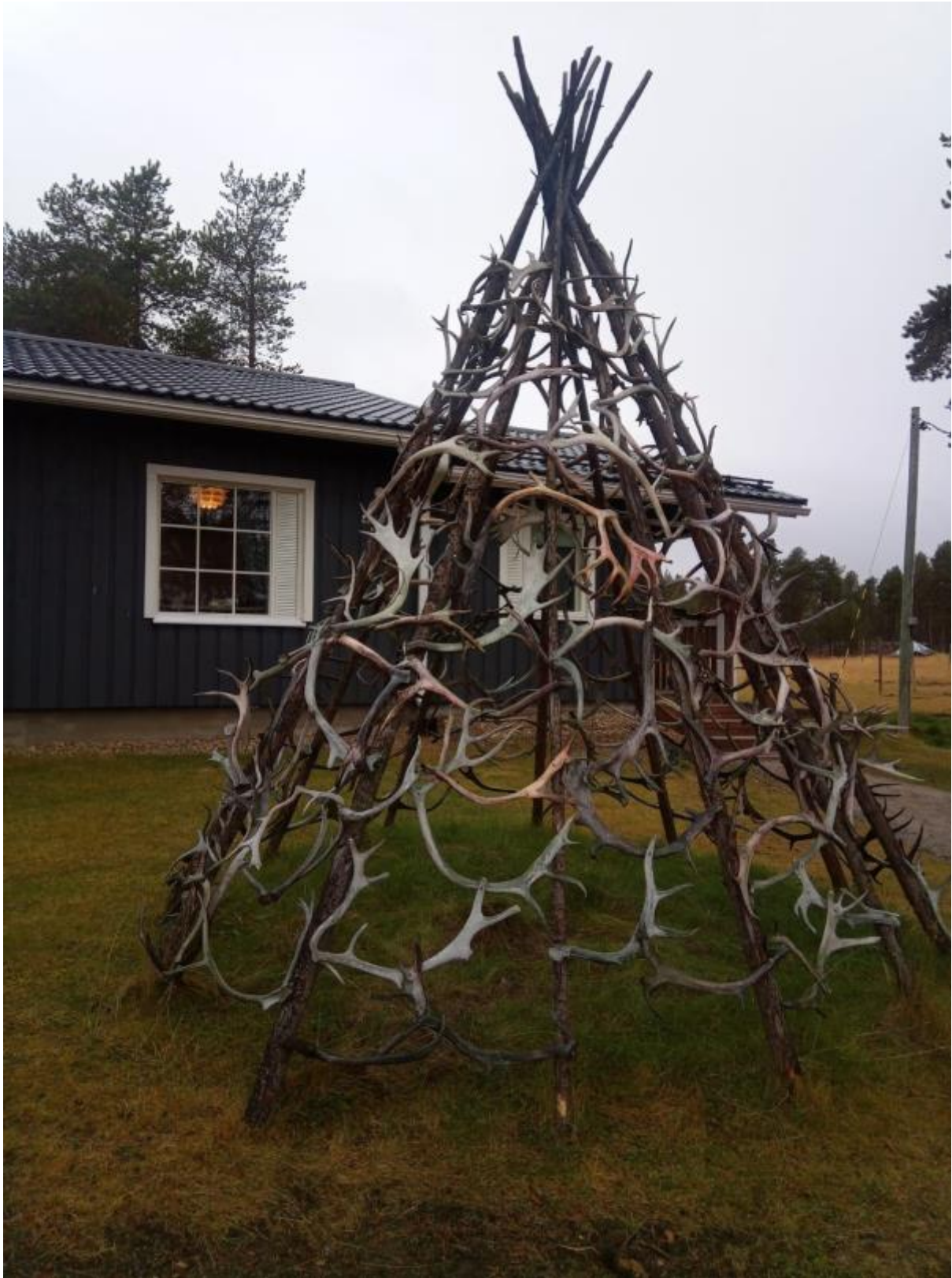
5 - Porotilalla oli pieni rakennus joka oli tehty puusta ja poron sarvista. Oli hieno! Porotilalla oli myös matkamuisto myymälä mutta en ottanut siitä kuvia.