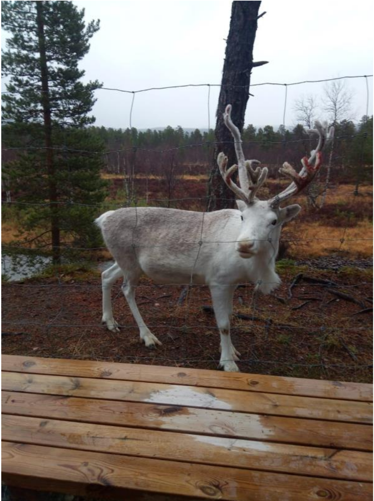
6 - Saatiin olla poro aitauksessa ja antaa poroille jonkin sortin ruokaa.