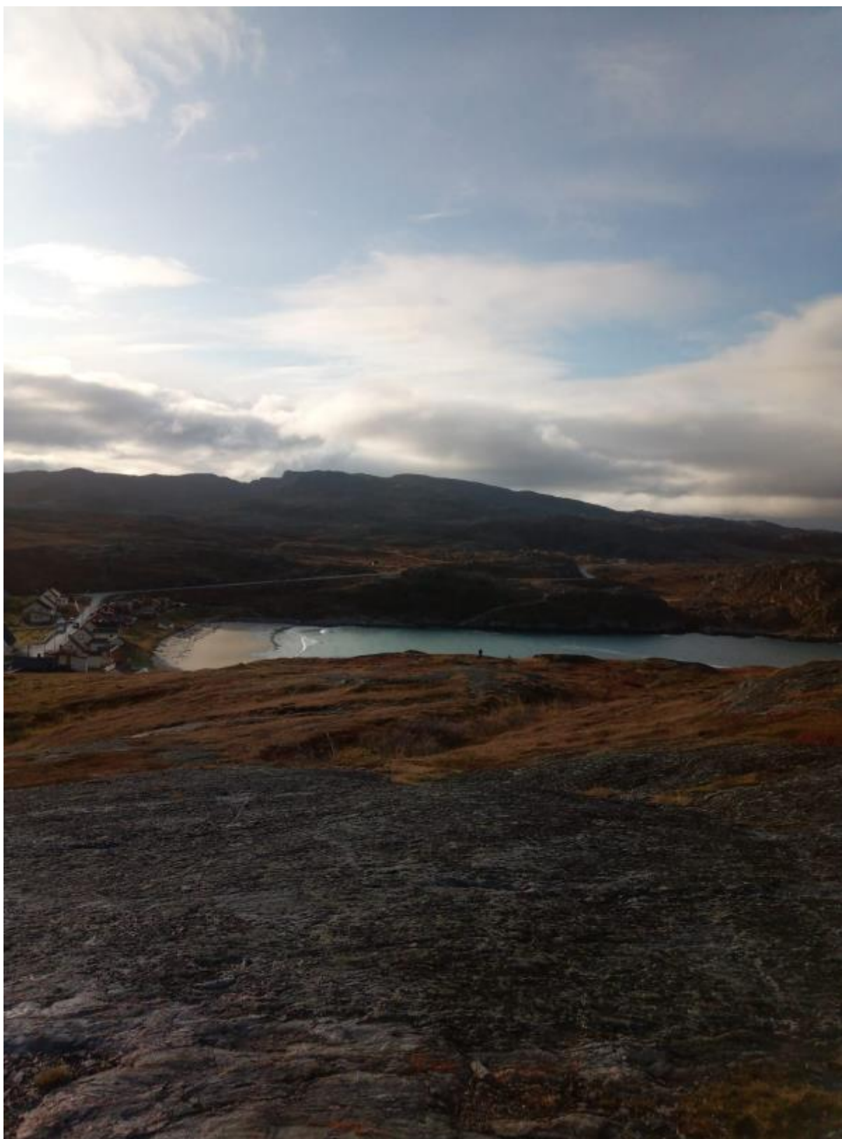
11 - Hiekkarannalle luokkamme kirjoitti JOPO, en saanut siitä kuvaa..