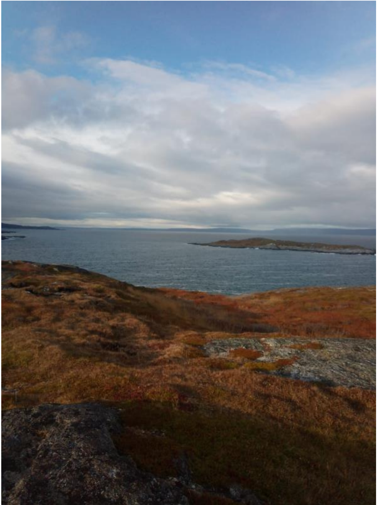
9 - Kalliot oli jäämeren vieressä.