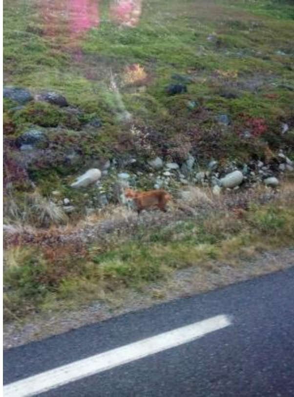
13 - Kettunen

Paluu matkalla suomeen me nähtiin myös söpö kettu joka oli juuri ylittänyt tai oli ylittämässä tietä. Oli toooosi söpö :))