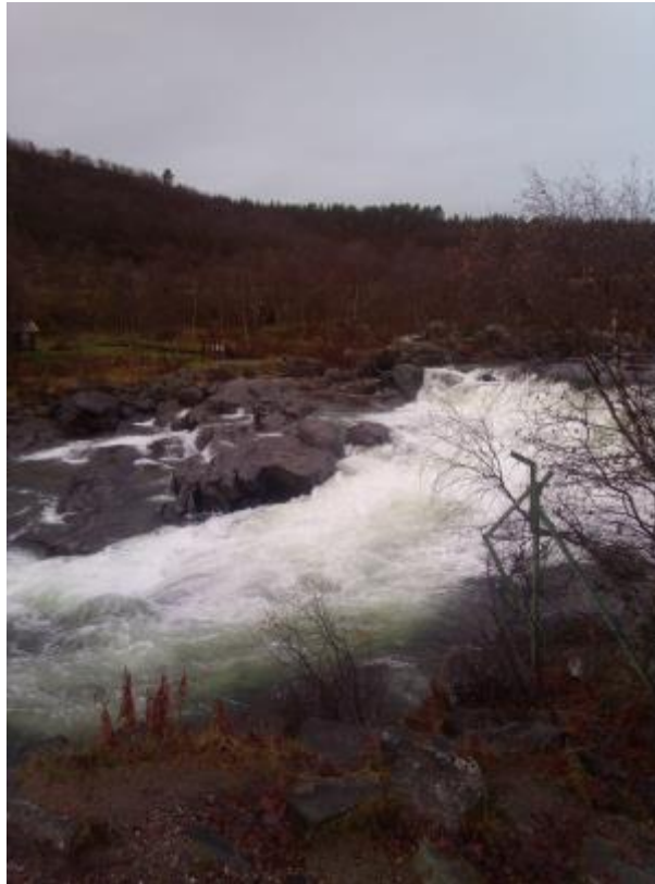
12 - koski

Kun pääsimme norjaan pysähdyimme hienolle kuohuavalle koskelle tai mikä olikaa. JA otimme kuvia siitä, tietysti xd