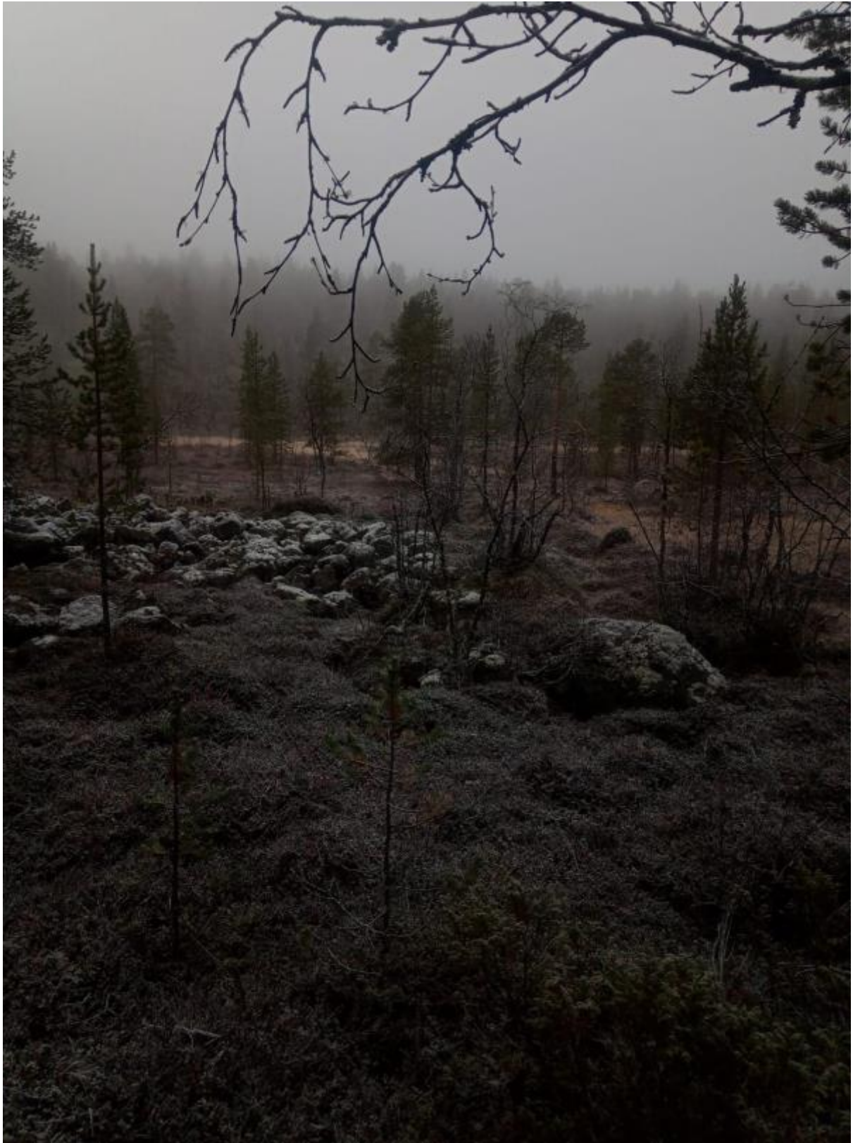
17 - Valloitimme tunturin loppu viikosta. Tunturin päällä paistoin makkaraa, Tunturin päällä oli myös paljon lunta.