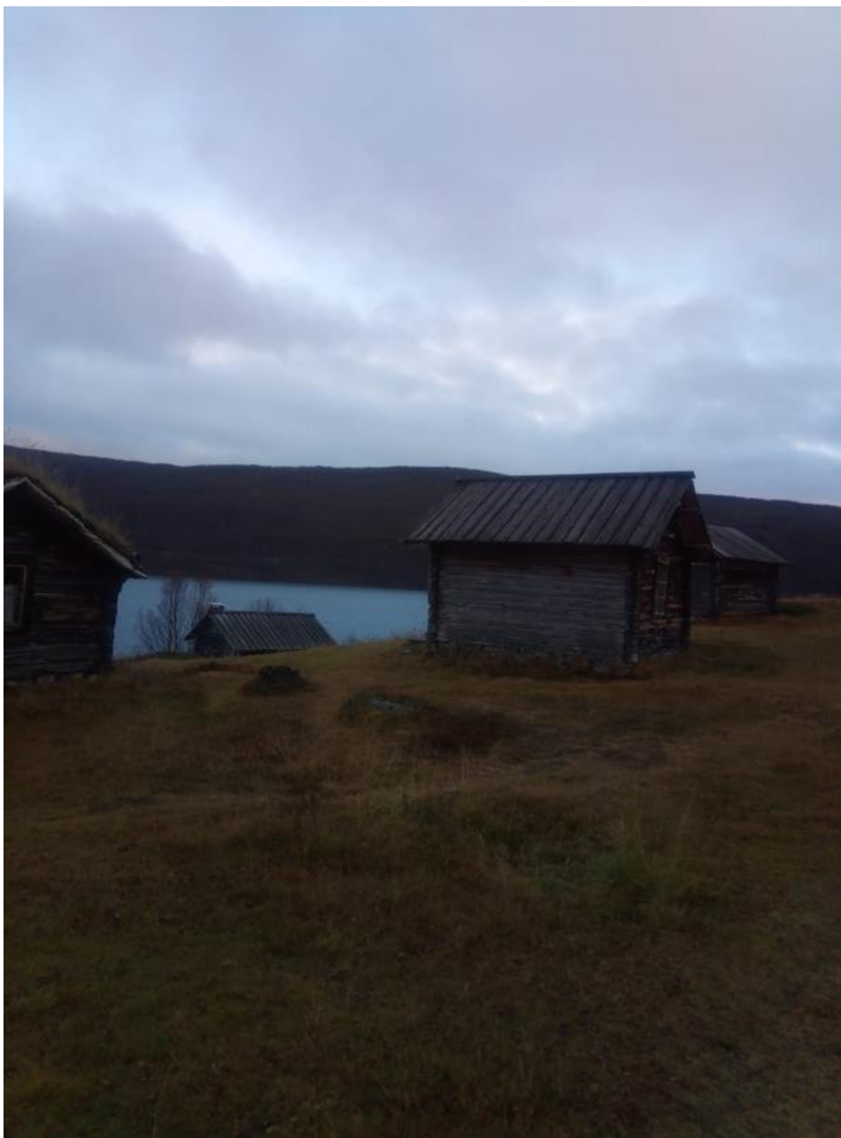
15 - Kylässä pääsimme joihinkin vanhoihin rakennuksiin sisälle. Rakennuksien oviaukot oli pieniä, tosi pieniä..