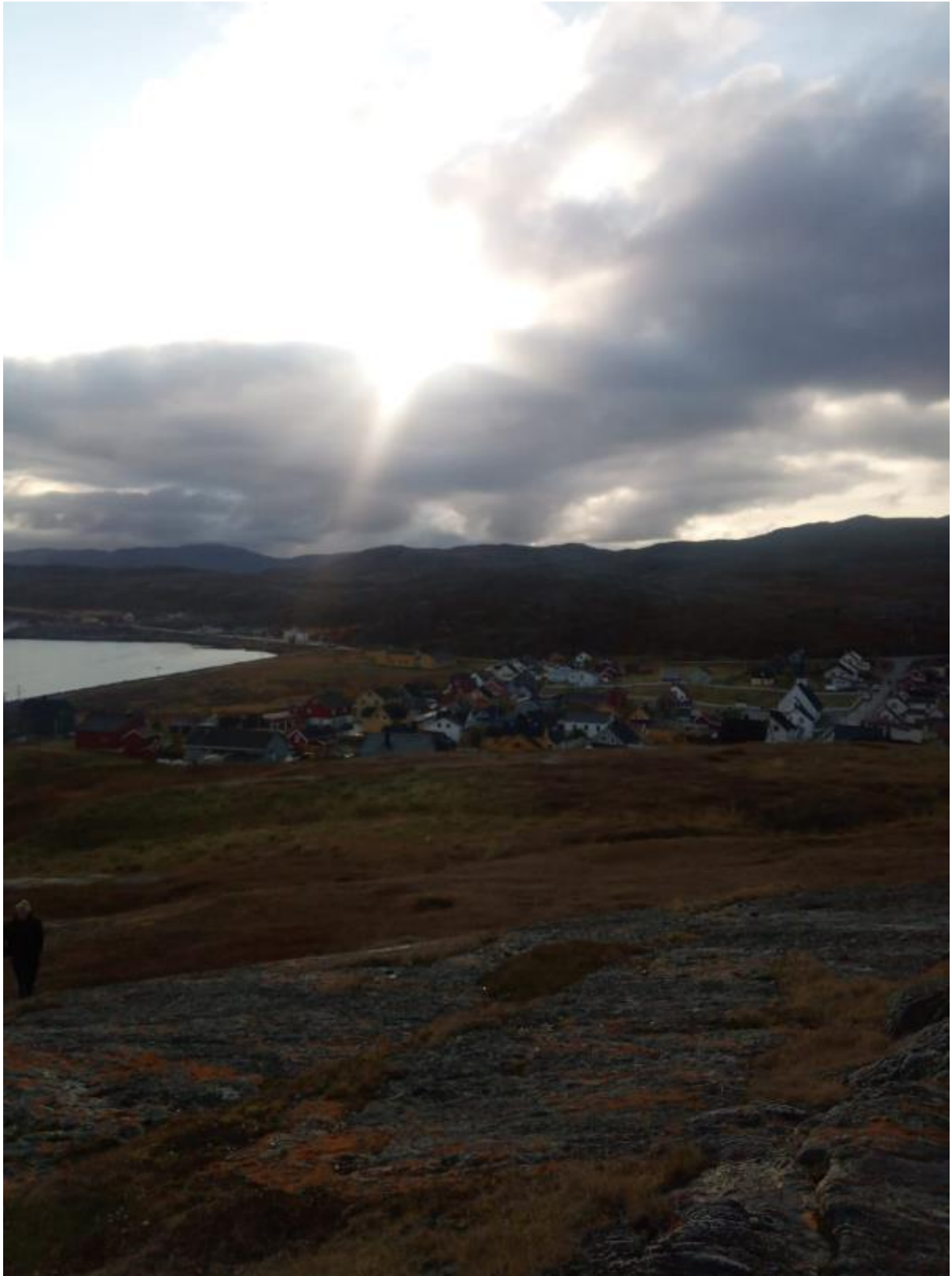
8 - Kiipesimme norjassa kalliolle.