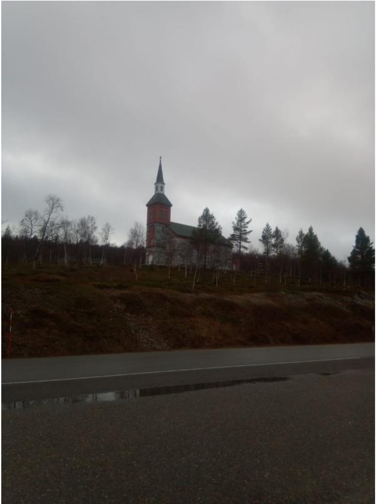
14 - Pysähdyimme kirkon ja pienen vanhan kylän viereen.