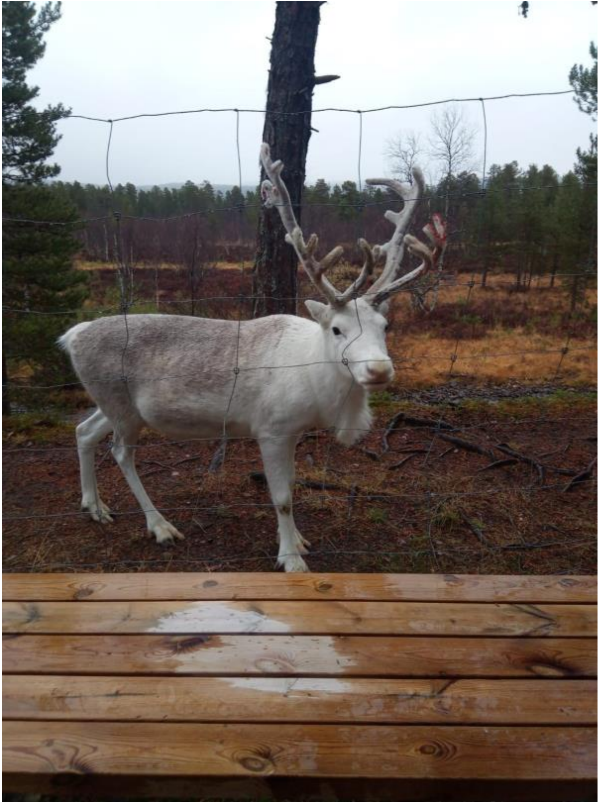
7 - Porot oli muuten aika ahneita.. söi kädet tyhjiks toisin sanoen!