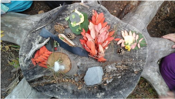
Kotileikki: lounaspöytä katettuna