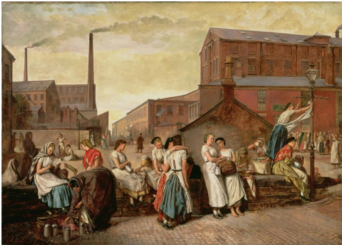
Eyre Crowe: The Dinner Hour, Wigan (1874)