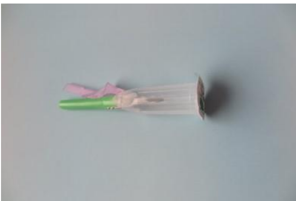
Kiinteä vakuuminäytteenoton turvaneula ja neulapidike

Laskimoverinäytteenotossa on käytössä useita eri neulatyyppejä. Perinteinen näytteenottoneula ei ole yksittäispakattu vaan steriili neulansuojus on sinetöity. Osa näytteenottoneuloista on yksittäispakattuja, kuten turvaneulat, siipineulat ja avonäytteenottoneulat. Kuvien näytteenottovälineet ovat käyttämättömiä ja avaamattomia ja niiden värit voivat vaihdella. Eri valmistajien vastaavat tuotteet voivat olla erinäköisiä ja -värisiä.