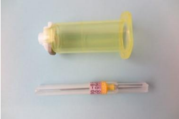
Näytteenottoneula ja neulapidike