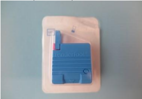
Lansetti ihopistos kantapää