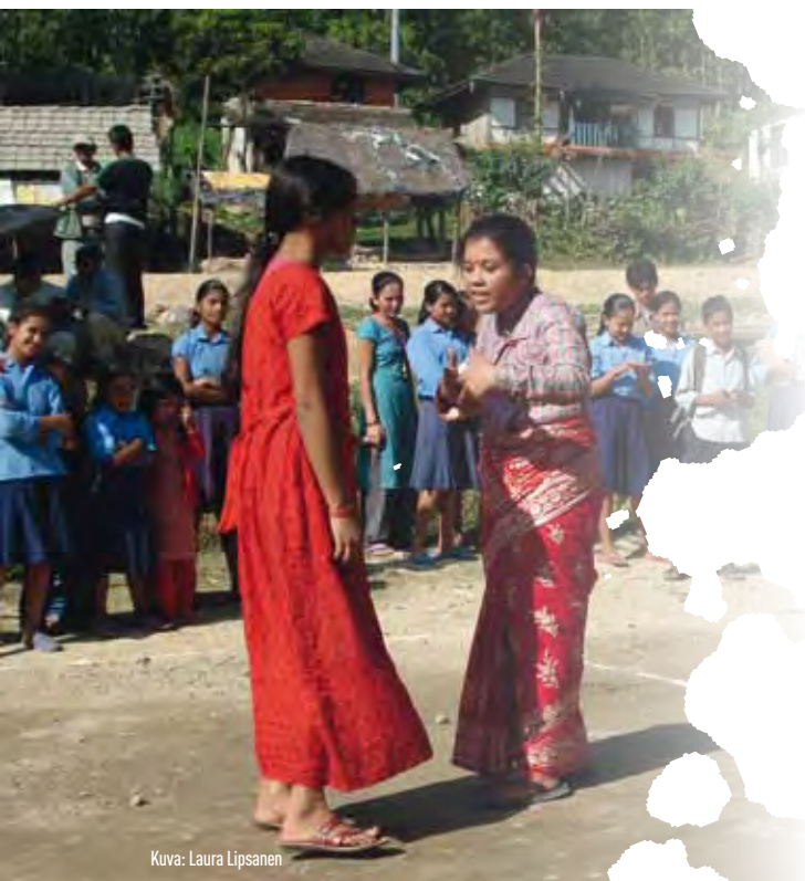
Kuva: Laura Lipsanen