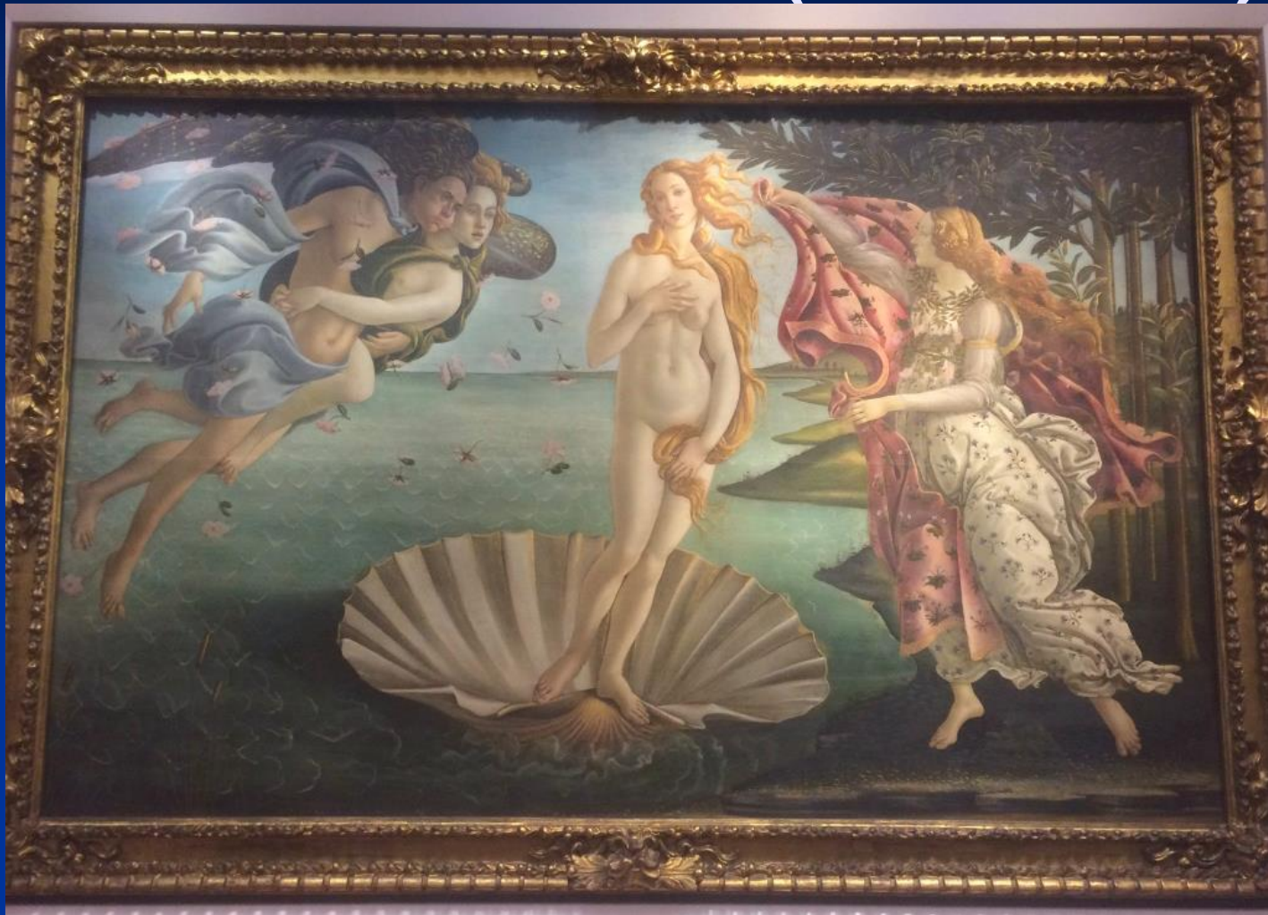
Venuksen syntymä (Sandro Botticelli, 1445-1510)