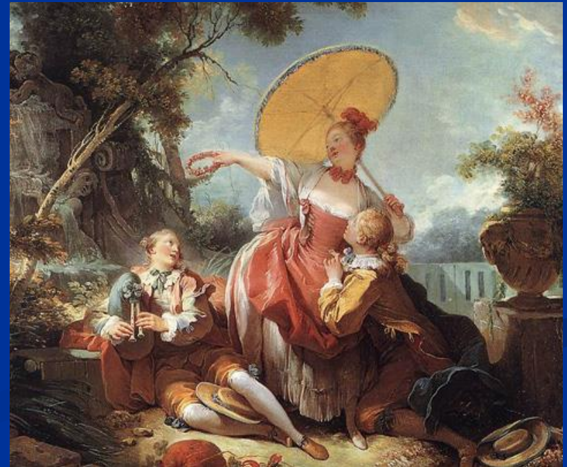
Jean-Honoré: The musical contest (1754)