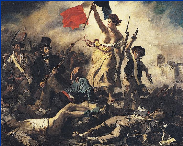
Eugène Delacroix: Vapaus johtaa kansaa (1830)