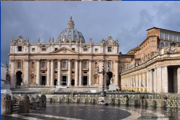
Pietarin kirkko, Vatikaani