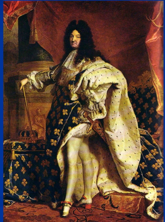
Ludvig XIV Aurinkokuningas