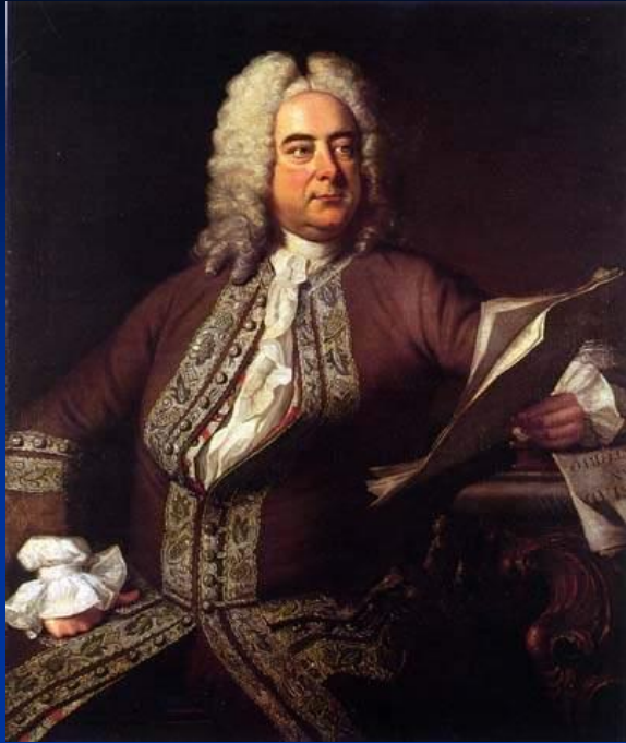
Georg Friedrich Händel