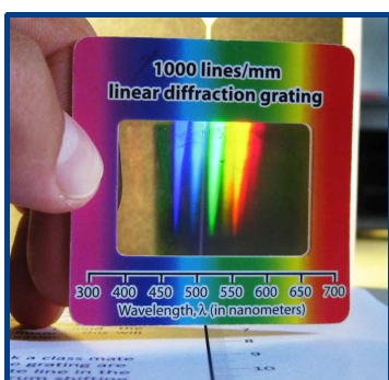
Fluoresoivan valon spektri