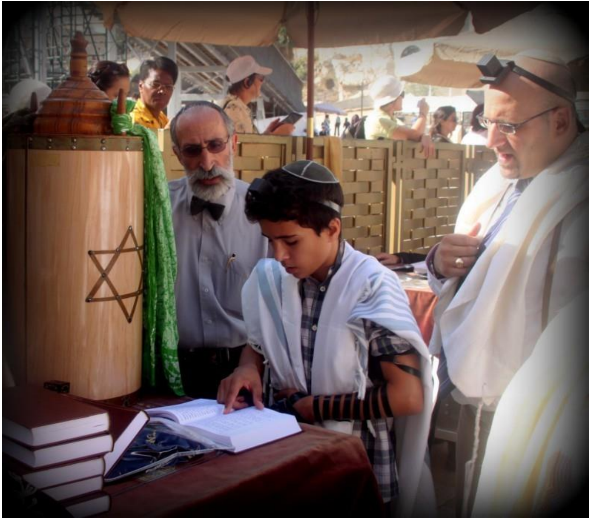
Juutalaispoika lukemassa pyhää kirjaa: https://peda.net/oppimateriaalit/eoppi/verkkokauppa/e7lum/8-juutalaisuus

Juutalaisille heidän historiansa on hyvin tärkeä. Monet Juutalaisten uskonnolliset juhlat, tavat ja pukeutumistyyli liittyvät vahvasti heidän historiaansa. Juutalaiset uskovat yhteen Jumalaan, jonka he uskovat tehneet pyhän liiton juutalaisten kanssa. Juutalaisuuden historia alkaa perimätiedon mukaan kantaisä Abrahamista. Abraham asui Urissa, eli nykyisen Irakin alueella, vuonna 1700- luvulla ekr. Jumalan pyynnöstä Abraham muutti Luvattuun maahan. Luvattu maa sijaitsi Välimeren itärannikolla, muinaisessa Palestiinassa. Myöhemmin Abrahamin jälkeläisten oli nälänhädän takia muutettava Egyptiin. Egyptissä heitä alettiin kutsua Israelin kansaksi. Nimi