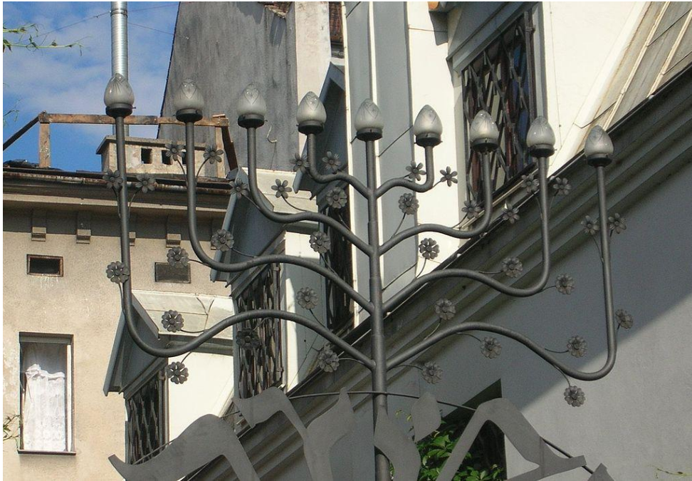
Menora kynttelikkö: https://fi.wikipedia.org/wiki/Menora#/media/File:Chanukija.jpg

Juutalaisuus on etninen ja monoteistinen uskonto. Juutalaisten Jumalan nimi on JHWH, joka lausutaan Jahve. Jumalan oikean nimen sanominen ääneen on kiellettyä, sillä ajatellaan, että ihminen on liian ala-arvoinen sanomaan Jumalan nimeä. Juutalaiset ajattelevat Jumalansa olevan yksi, jakamaton, rajaton, vailla alkua tai loppua ja vailla aineellista ruumista. Kukaan ei tiedä miltä Jumala näyttää, eikä hänestä voi tehdä kuvaa, ja kuvan tekeminen on kiellettyä.