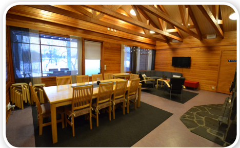
Takkahuonetta ryhmät voivat käyttää mm. saunavuoron yhteydessä.