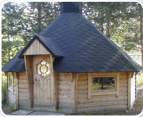
Iltapalan voi nauttia myös kodalla.