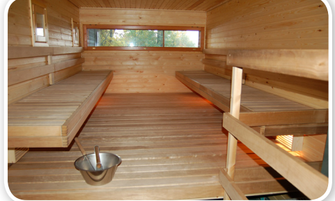
Saunavuoron voi varata ohjelmaan etukäteen.