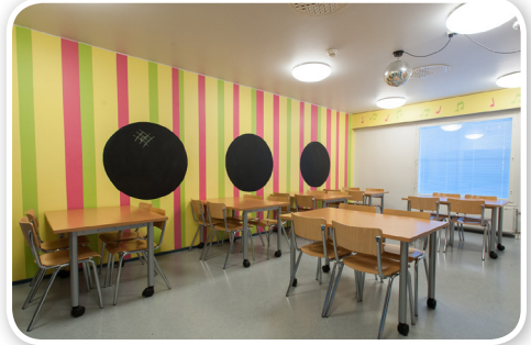
Askartelutila Katarina toimii mm. kädentaito-ohjelmissa sekä leiridiskojen pitopaikkana.