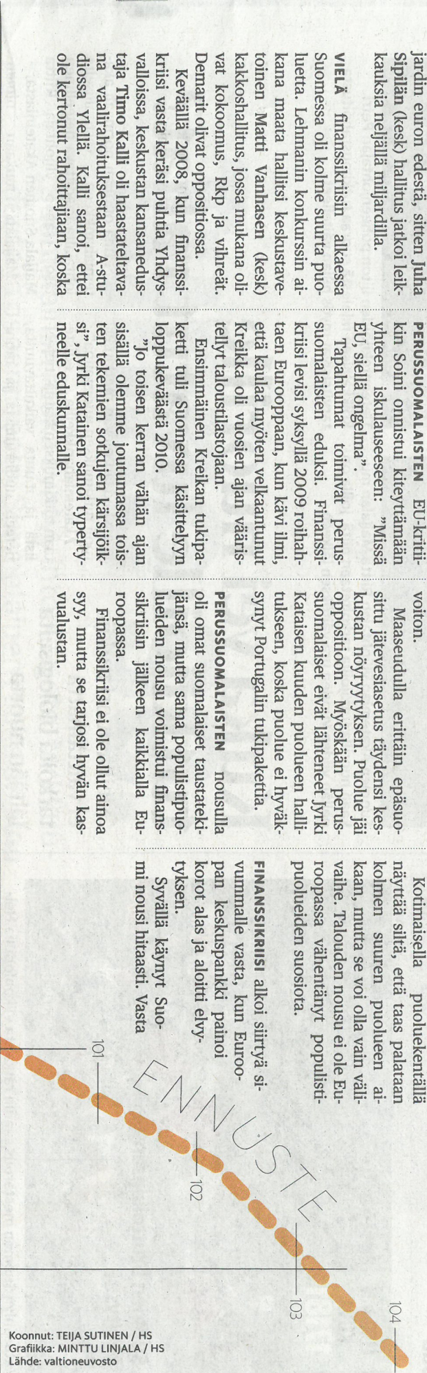
Koonnut: TEIJA SUTINEN / HS Grafiikka: MINTTU LINJALA / HS Lähde: valtionuuvosto

Finanssikriisi osoittautui myös poliittisesti paljon räjähdysherkemmäksi kuin tavanomaisen taantumana. Se ei ollut mitään yksittäisen häiriö ventialitysynnäs-sä, vaan syvällinen järjestelmätason ongelma. Se oli armoton pallasaassaan poliitikkojen, markkinoiden säätelijöiden ja EU:n avuttomuuden ja vaikutudet saada kriisi hallintaan.