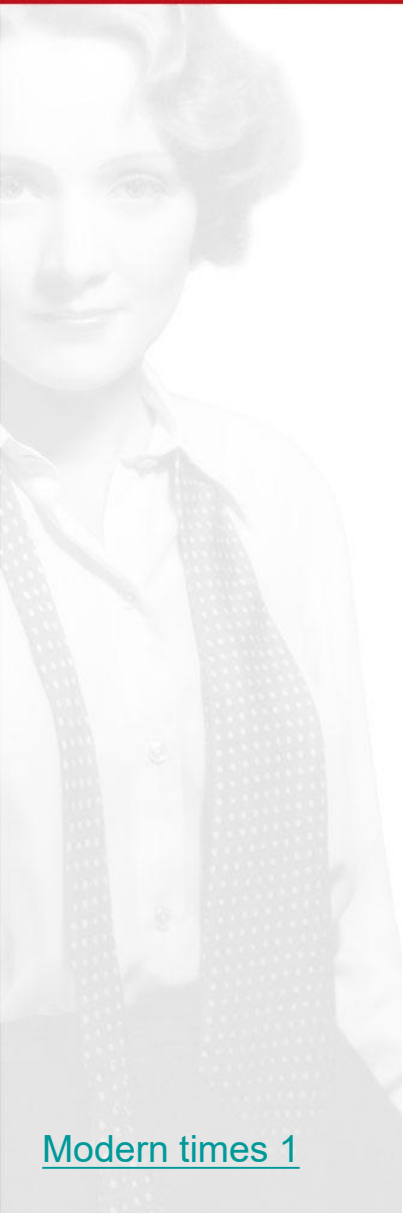
Modern times 1