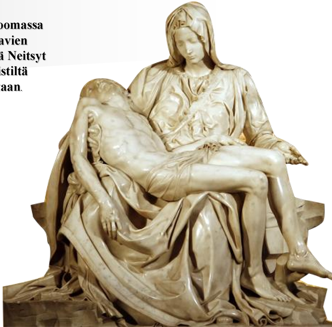
Michelangelon Pietá-patsas (1499).

■ Pietá on yksi niistä veistoksista, jotka Michelangelo teki Roomassa Medici-sukuisten paavien tilauksesta. Se esittää Neitsyt Mariaa suremassa ristiltä otettua Jeesusta, lastaan.