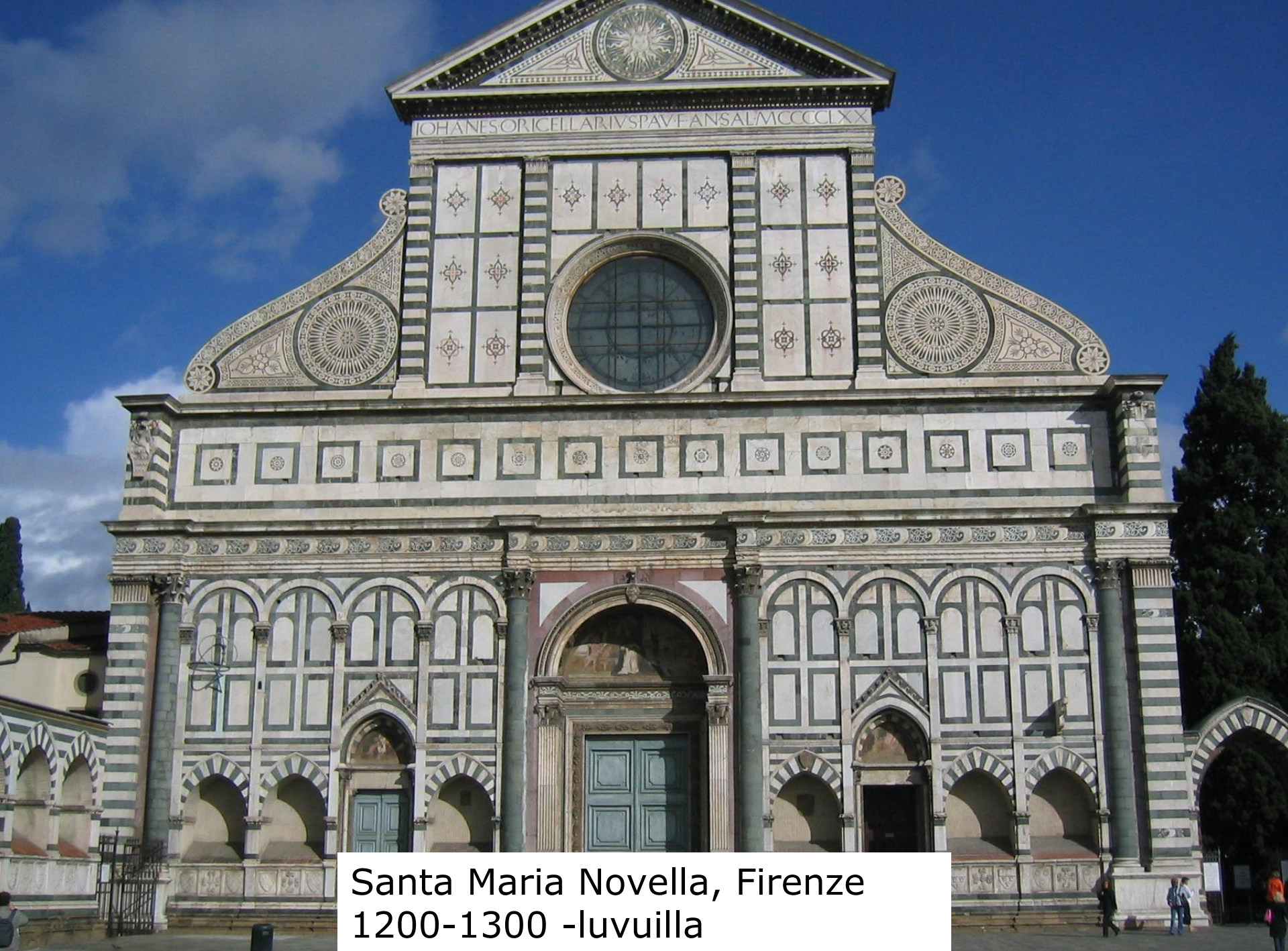
Santa Maria Novella, Firenze 1200-1300 -luvuilla