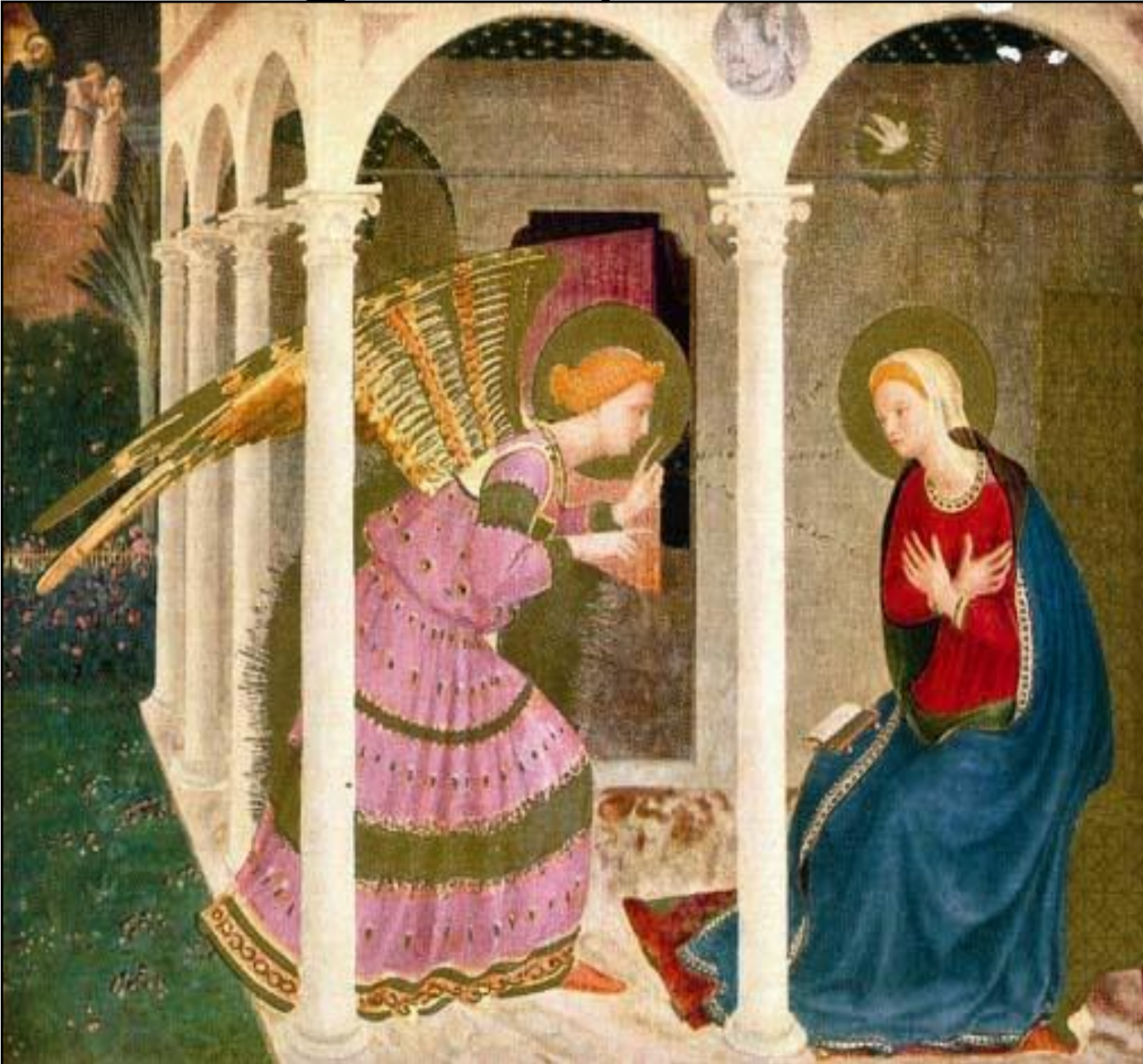
Fra Angelico, Neitsyt Marian ilmestys, n. 1437