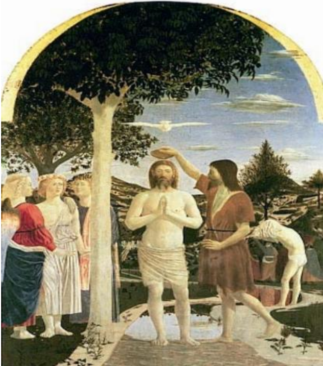
della Francesca Kristuksen kaste, n. 1445