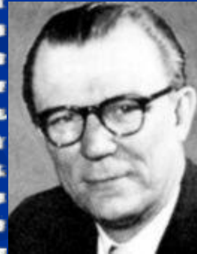
Penna Tervo sd

Suomen presidentinvaali 1956 – Wikipedia