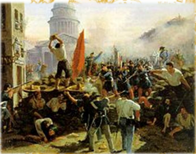
Kapinointia Pariisissa 1848