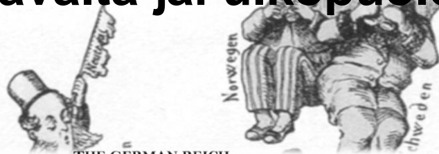
THE GERMAN REICH 1871-1918