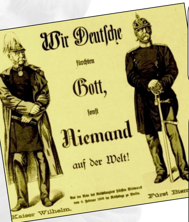
Saksalainen propagandajuliste vuodelta 1888.