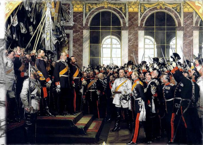
Vilhelm I kruunataan Saksan keisariksi Versaillesissa 1871