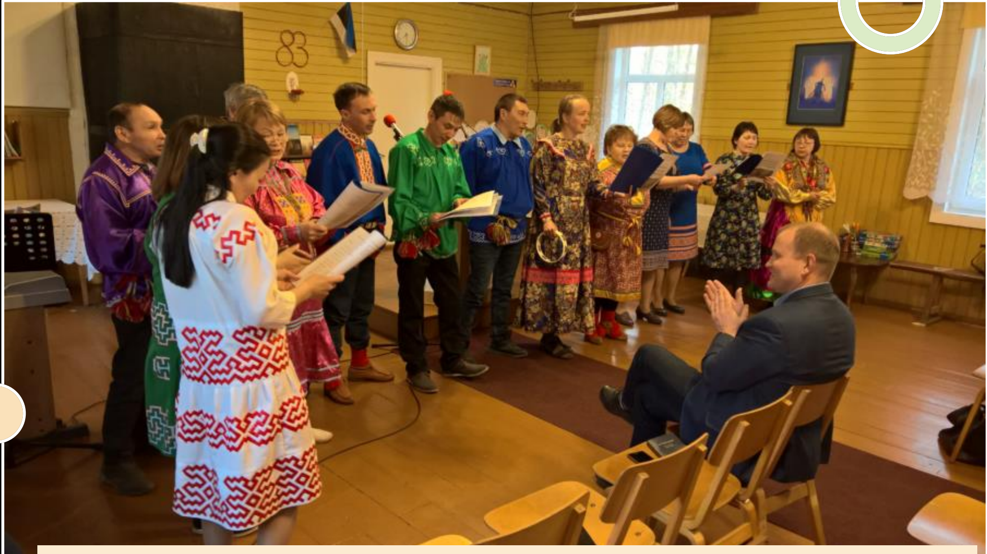
Yli 3 miljoonaa Venäjän vähemmistöistä kuuluu suomensukuisiin kansoihin. Kuva: R. Lehtonen. https://www.raulilehtonen.com/fi/2020/10/23/venajan-vahemmistot-unohtuvat/