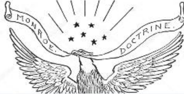
Jakso 1. Kansainvälisen politiikan näyttämöllä