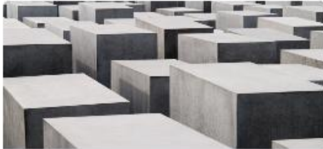
Jakso 5. Kansanmurhat historian kipupisteinä