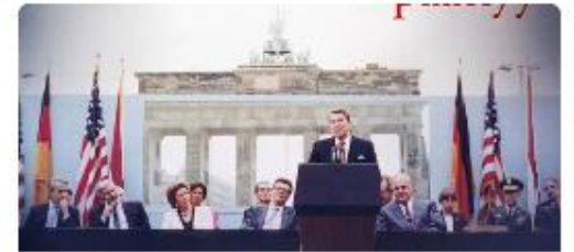
Jakso 7. Maailman valtakeskukset