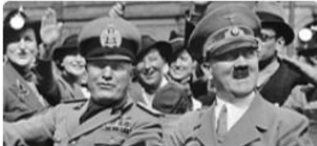
Jakso 3. Demokratioista diktatuureihin