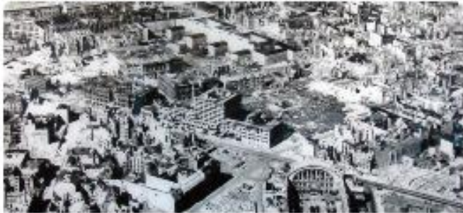
Jakso 4. Toinen maailmansota