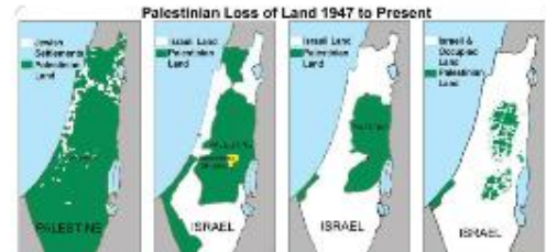
Jakso 8. Konflikteja ja rauhanpyrkimyksiä 2000-luvulla