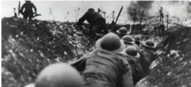
Jakso 2. Suurvaltojen valtapyrkimykset vuosina 1870-1918