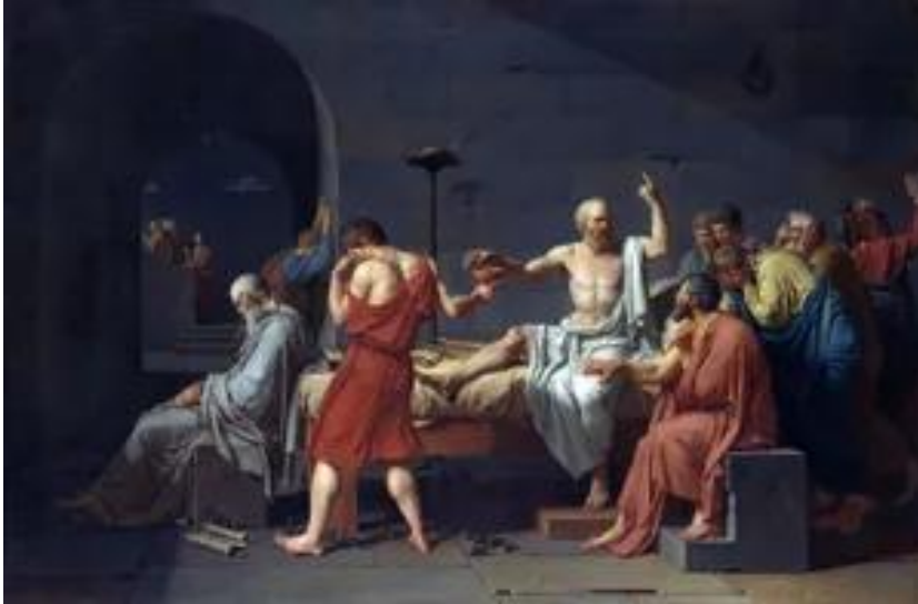
The Death of Socrates, Jacques-Louis David, 1787