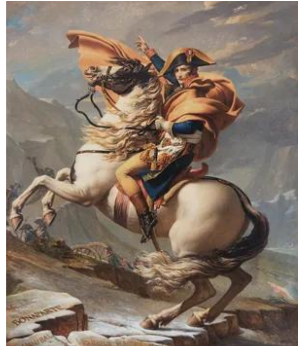
Napoleon Crossing the Alps, Jacques-Louis David, 1801