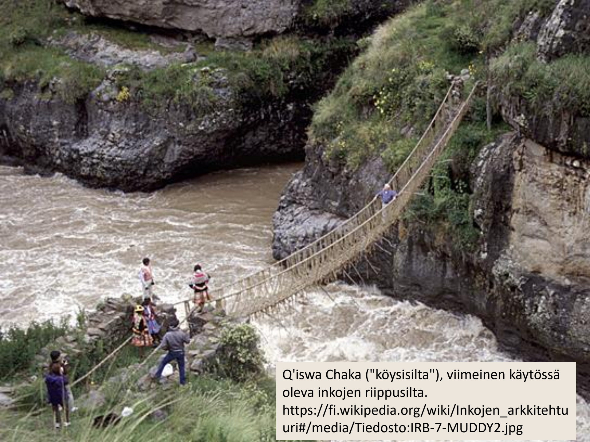
Q'iswa Chaka ("köysisilta"), viimeinen käytössä oleva inkojen riippusilta. https://fi.wikipedia.org/wiki/Inkojen_arkkitehtuuri#/media/Tiedosto:IRB-7-MUDDY2.jpg