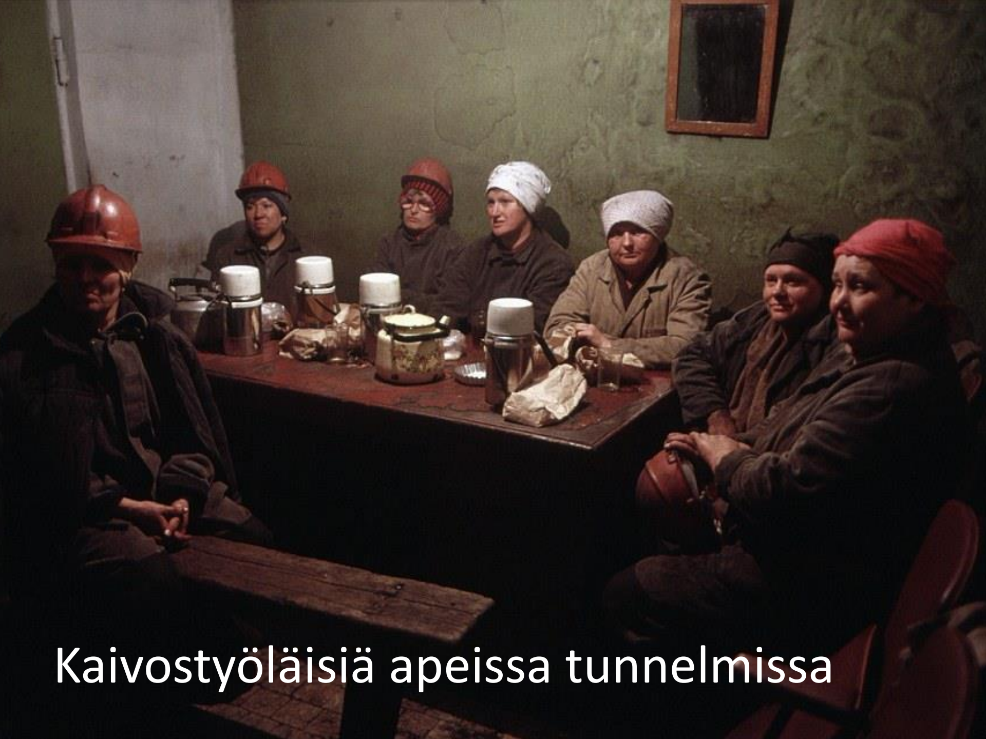
Kaivostyöläisiä apeissa tunnelmissa