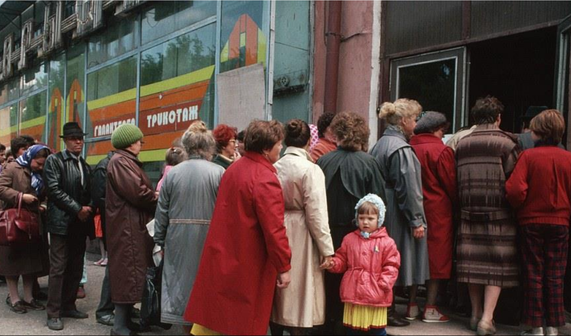
Ruoka alkoi loppua kaupoista ja venäläisten elämä muuttui jatkuvaksi jonottamiseksi.