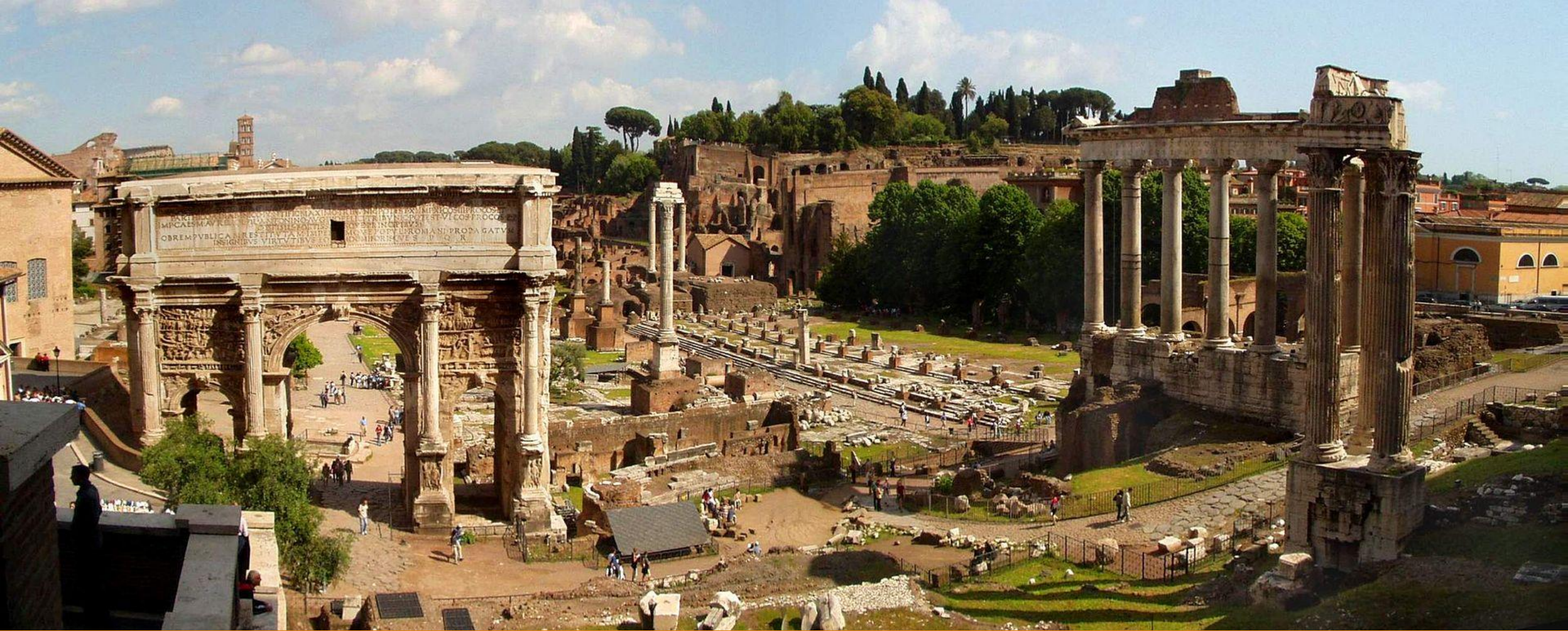
Forum Romanum – mahtavat julkiset rakennukset Imperiumin keskustori