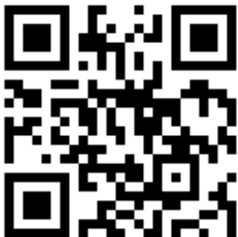
PEDANET QR CODE