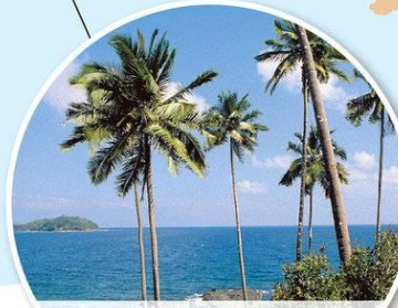
Önge-kansan kotiseutu Andamaanien saaristo koostuu 550 saaresta, joista vain muutama kymmenen on asuttuja.

Xam Metsästyksellä ja keräilyllä elänyt Xam-kansa on surullinen esimerkki siitä, miten kieli kirjaimellisesti tapettiin. 1700-luvulla Xamien maille Etelä-Afrikkaan tulleet buurit veivät ensin heiltä elinkeinon. Kun Xamit nousivat buureja vastaan, nämä orjuuttivat naiset ja lapset ja tappoivat miehet. Viimeiset Xam-kielen puhujat kuolivat noin sata vuotta sitten. Pystyviiva xam-sanana edessä tarkoittaa maiskausäännettä, joka tehdään maiskauttamalla kieltä etuhampaisiin.