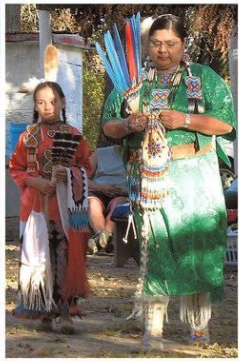
Pawnee-heimoon kuuluvat nainen ja tyttö valmistautuvat perinteiseen tanssiseremoniaan.