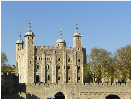
TOWER OF LONDON