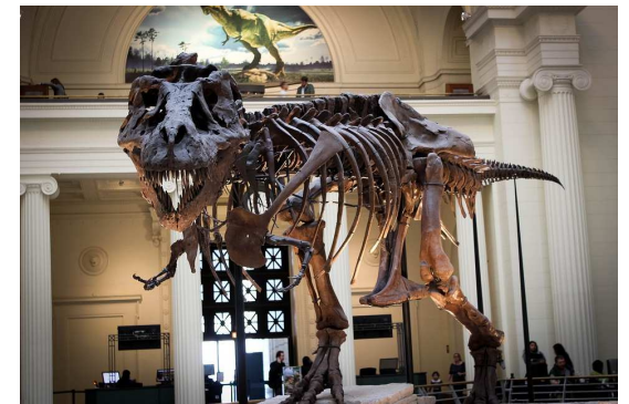
NATURAL HISTORY MUSEUM