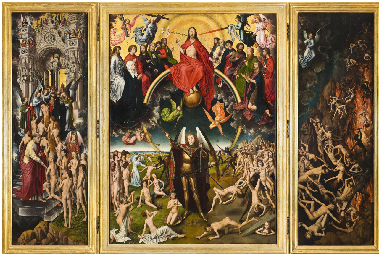
© Hans Memling. Viimeinen tuomio (1466–1473).

Taivas on rauhan ja hyvätahdon tyyssija (levolliset ilmeet ja eleet, rikkauksia kuvastava portti)