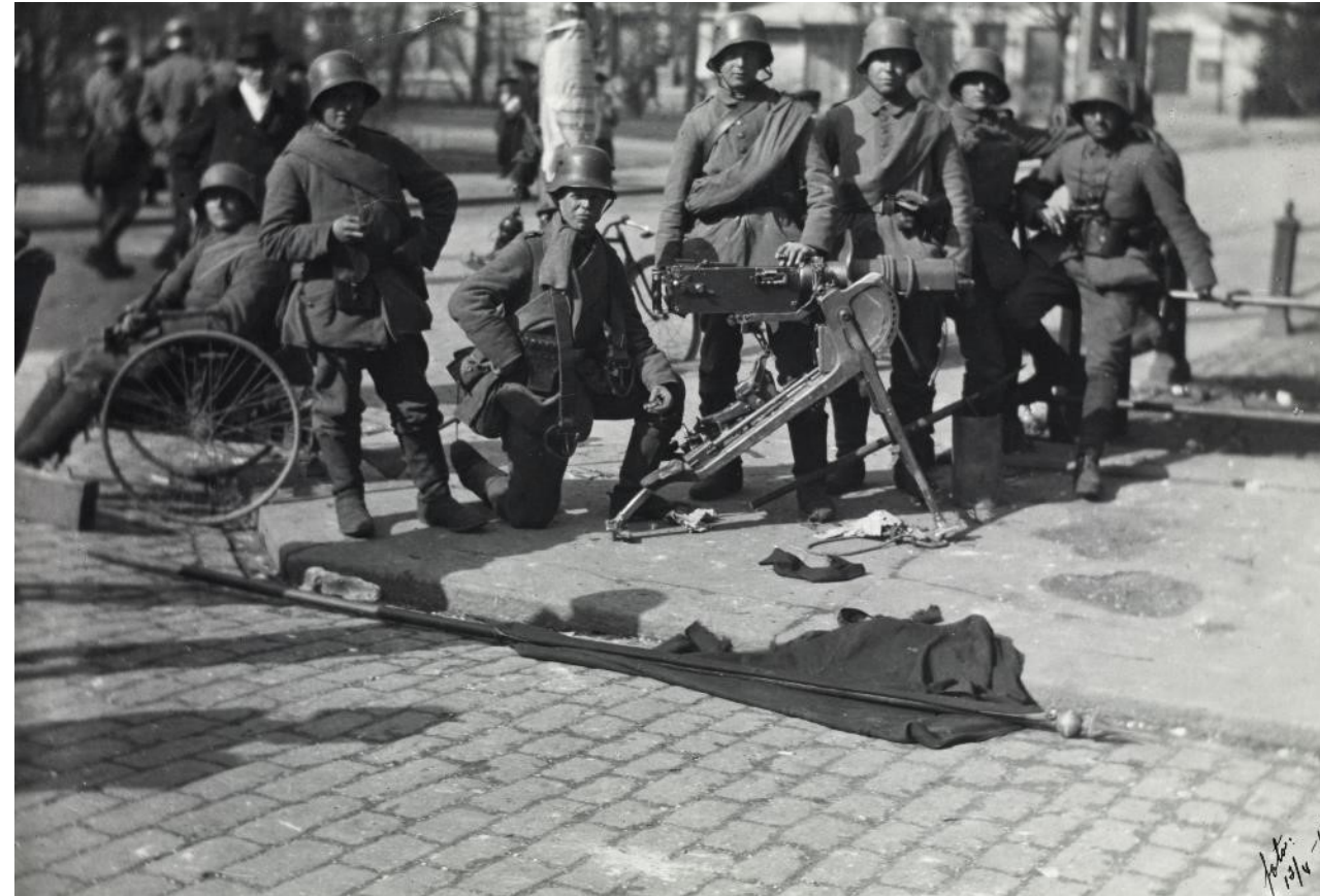
Kuvassa saksalaisia sotilaita Helsingissä Esplanadilla konekiväärin kanssa.