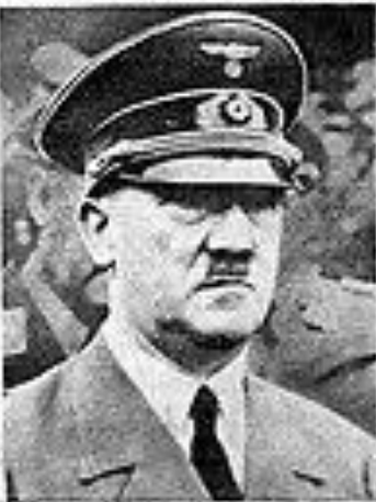
Adolf Hitler at his night duty at his command post.

Washington, May 1 (AP)—Winston Churchill, British prime minister, today hinted that peace is at hand. He said in a speech to the House of Commons that the British government is prepared to discuss peace terms with the Soviet Union and the United States. Churchill said that the British government is prepared to discuss peace terms with the Soviet Union and the United States. He said that the British government is prepared to discuss peace terms with the Soviet Union and the United States.