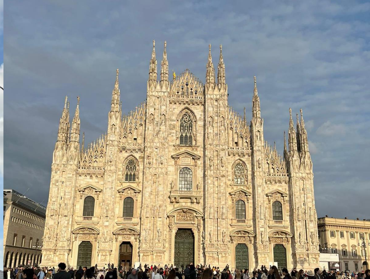
Duomo Milano maailman 5. suurin kirkko