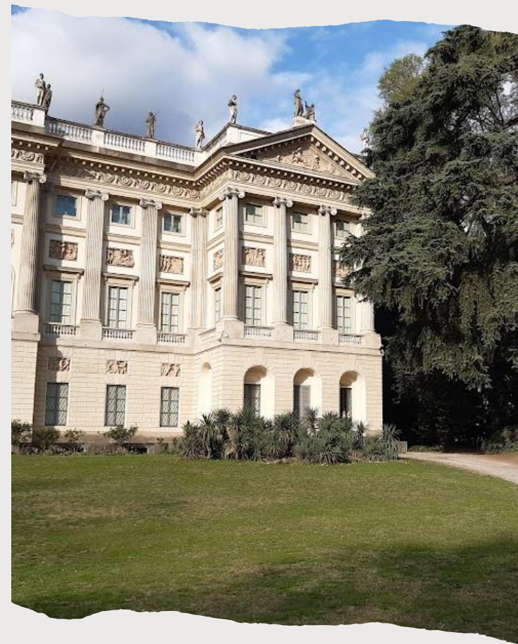
F Milanon vihreyttä