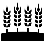
Gluteenia sisältävät viljat