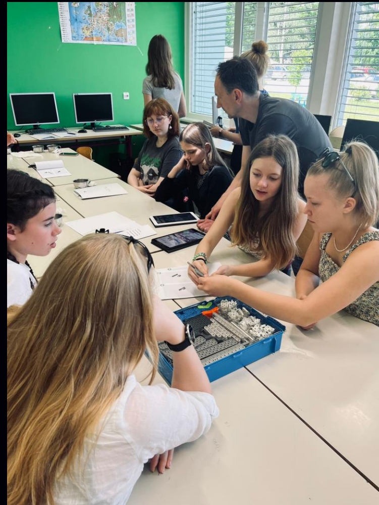
Esittelimme vex-robotteja Slovenialasille. Jätimme heille haasteen syksyä varten ;)