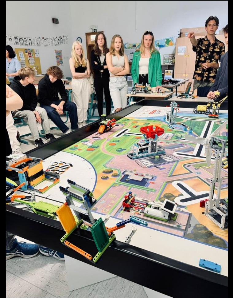
Tutustuimme Lego robojen maailmaan, teemana energiakriisi.