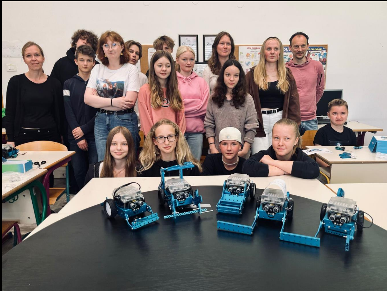
Rakensimme Mbot-robotit ja osallistuimme niillä sumo fight haasteeseen.