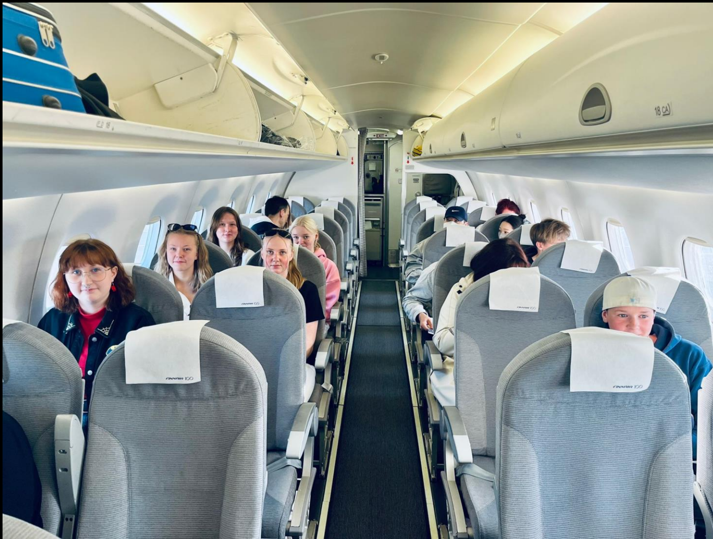
Matkat sujuivat ongelmitta ja osa pääsi kokemaan oman ensimmäisen lentomatkan.