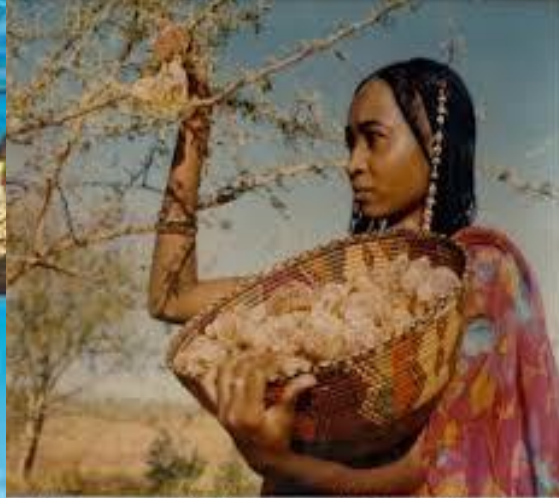
Young woman collecting gum arabic from low branches of acacia tree in the Kordofan region of Sudan.